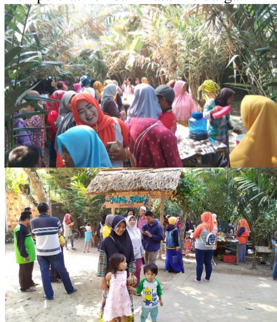
Gambar 6. Pengunjung Pasar jajan ngisor Wit Salak Dewasarejo

memanfaatkan liburan sebagai sarana untuk mempererat kembali ikatan keluarga.