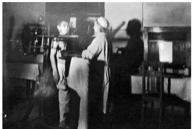
Рис. 4. Проведение рентгенокопии грудной клетки в эвакуационном госпитале № 3765 (Уфа) в годы Великой Отечественной войны Figure 4. Chest X-ray examination in the hospital No.3765, Ufa, at the Great Patriotic War time

Безусловно, в годы войны, как и в настоящее время, ведущими методами первичной диагностики пневмонии являлись анализ жалоб, анамнеза и дан-