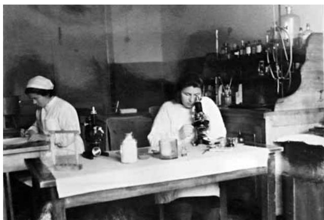
Рис. 5. Клиничко-диагностическая лаборатория эвакуационного госпиталя № 3765 (Уфа) Figure 5. Diagnostic laboratory of the hospital No.3765, Ufa

Большое значение придавалось немедикаментозному лечению пневмоний (рис. 6). Отделение физиотерапии эвакуационного госпиталя № 3765 было оснащено электрическим вибромассажером грудной клетки, инфракрасной лампой «Солюкс», аппаратами гальванизации, диатермии, паровыми ингаляторами. Активно применялись массаж и грязелечение.