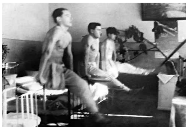
Рис. 7. Занятия ЛФК с ранеными в эвакуационном госпитале № 3765 (Уфа) Figure 7. Physical rehabilitation of wounded patients at the hospital No.3765, Ufa