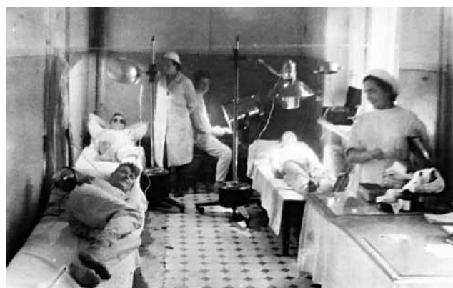
Рис. 6. Проведение процедур в отделении физиотерапии в эвакуационном госпитале № 3765 (Уфа) Figure 6. Physiotherapeutic treatment at the hospital No.3765, Ufa

В 1941–1942 гг. в клинике кафедры госпитальной терапии БМИ доцентом З.Ш.Загидуллиным под руководством заведующего кафедрой профессора Д.И.Татарина разработан улучшенный способ внутривенного введения сульфидина на основе кислого раствора, который был существенно стабильнее других растворимых форм препарата для паренте-