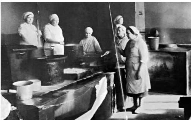
Рис. 8. Персонал и оборудование пищеблока эвакуационного госпиталя № 3765 (Уфа) Figure 8. Staff of a food unit at the hospital No.3765, Ufa

Несмотря на тяжелое, полное лишений военное время, в БМИ активно велась научно-исследовательская работа. За период Великой Отечественной войны защищены 2 кандидатские диссертации, посвященные изучению пневмонии. В 1942 г. доцентом кафедры госпитальной терапии БМИ З.Ш. Загидуллиным защищена кандидатская диссертация «О некоторых гемодинамических показателях при крупозной пневмонии». В результате изучения 158 случаев пневмонии с использованием капилляроскопии, измерения АД и венозного давления и прямого измерения скорости кровотока определены гемодинами-