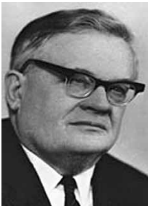
Рис. 2. Выдающийся советский вирусолог академик РАМН А.А.Смородинцев (1901–1986) Figure 2. Outstanding Soviet virologist Academician of the Russian Medical Science Academy A.A.Smorodintsev (1901 – 1986)

Если пандемия гриппа 1918–1919 гг. унесла до 40 млн жертв, то в пандемию 1943–1944 гг. смертность составила всего доли процента. Осложнения при гриппозной пандемии 1943–1944 гг. наблюдались достаточно редко, пневмонии – в 3,6 % случаев. Тем не менее при пандемии гриппа 1943–1944 гг.