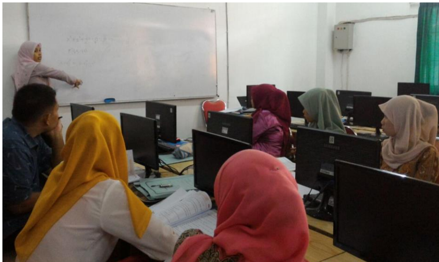
Gambar 1. Uji coba modul konstruktivisme dan website

Pengembangan modul konstruktivisme dan website pada materi lingkaran dan bola menggunakan model ADDIE. Hasil yang diperoleh dari tahap implement untuk melihat kepraktisan modul konstruktivisme dan website . Tahap ini tindakan yang dilakukan adalah uji coba terhadap modul konstruktivisme dan website pada 10 orang mahasiswa STKIP PGRI Sumatera Barat yang telah mengambil mata kuliah Geometri Analitik. Pada tahap ini dilihat kepraktisan dari modul dan website dengan melakukan uji coba sebanyak 4 kali, dan memberikan angket kepraktisan dan melakukan wawancara terhadap 2 orang mahasiswa yang telah ikut dalam uji coba modul konstruktivisme dan website pada materi lingkaran dan bola. Berikut adalah gambar yang memperlihatkan saat uji coba modul konstruktivisme dan website pada materi lingkaran dan bola.