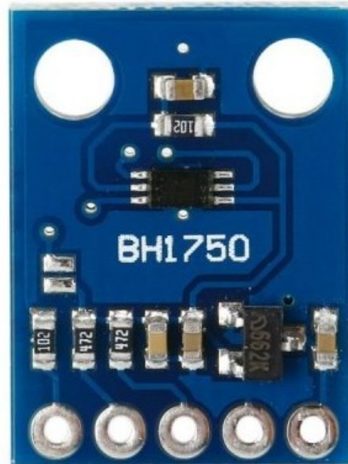
Figura 2. Sensor de Luz BH1750

placa Arduino, permite lograr el nivel lumínico óptimo para el desarrollo del cultivo.