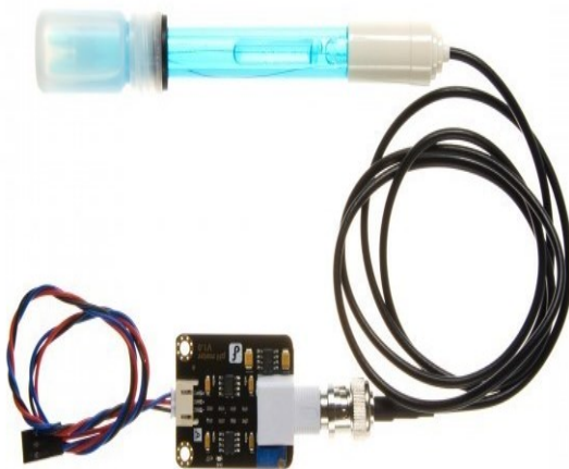
Figura 3. Sensor de pH MSP43

Mediante el uso de sensores como el MSP430, dispositivos que distribuyan de manera uniforme el agua y sus nutrientes, así como el microcontrolador Arduino, es posible analizar los niveles de pH y generar las medidas necesarias para el funcionamiento del sistema.