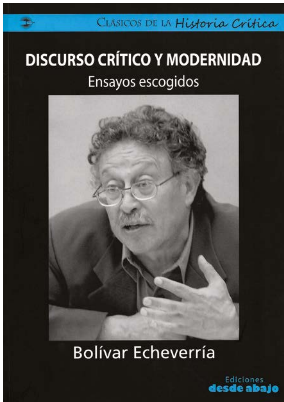
Imagen 1. Carátula del libro: Discurso crítico y modernidad: ensayos escogidos . Bolívar Echeverría (2011). Bogotá: Ediciones desde abajo.

en cuanto tal, como ese personaje tan especial, tan dotado, tan excepcional ente de la vida social, puede desaparecer en cuanto tal y fundirse en una 'artisticidad' generalizada del público. Es decir, que la sociedad liberada sea aquella en la cual todos sus miembros estén en capacidad de comportarse como artistas.