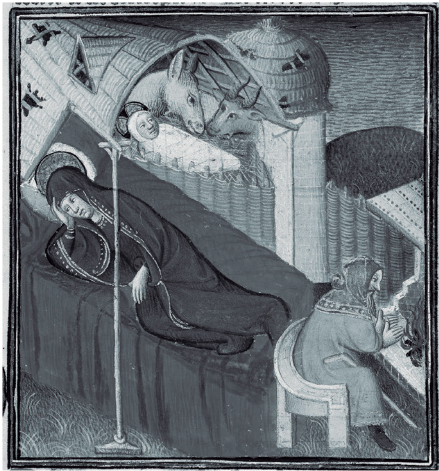
Fig. 1. British Library, Royal 19 D III. Gran Biblia Historiada. 1410.

Así pues, el caso concreto de las obras paralitúrgicas alemanas –como también el de la producción de imágenes en el contexto de la cultura libraria–, nos presenta indicios claros sobre un proceso del que seguramente el sujeto medieval no fue reflexivamente consciente, pero que, no obstante, puede ser considerado como un inquietante precedente de las consideraciones contemporáneas que no solo ven el género , sino también el cuerpo , como lugares culturales variables y como categorías construidas a partir de convenciones de lenguaje. Aquí, el nacimiento de la familia moderna –con las nuevas exigencias sociales que trajo consigo–, supuso un ejercicio de redefinición antropológica de los usos del cuerpo prescritos por la Iglesia temprana, una redefinición que –a pesar del marcado contraste que ofrece con las concepciones que sobre la corporalidad se desarrollaron entre la Antigüedad