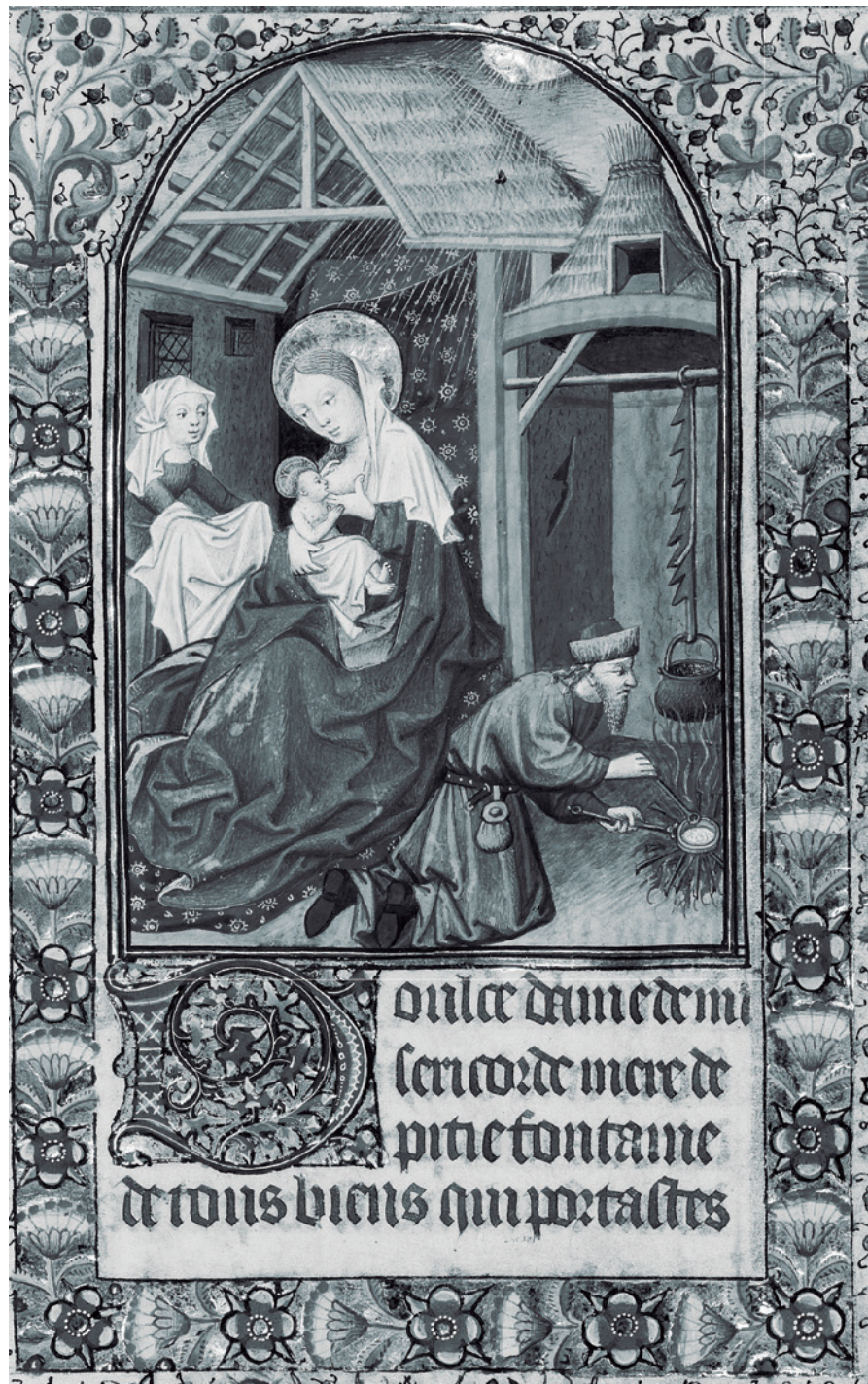
Fig. 2. Paul Getty Museum, Ms. Ludwig IX 6. Libro de Horas. 1440-1450.