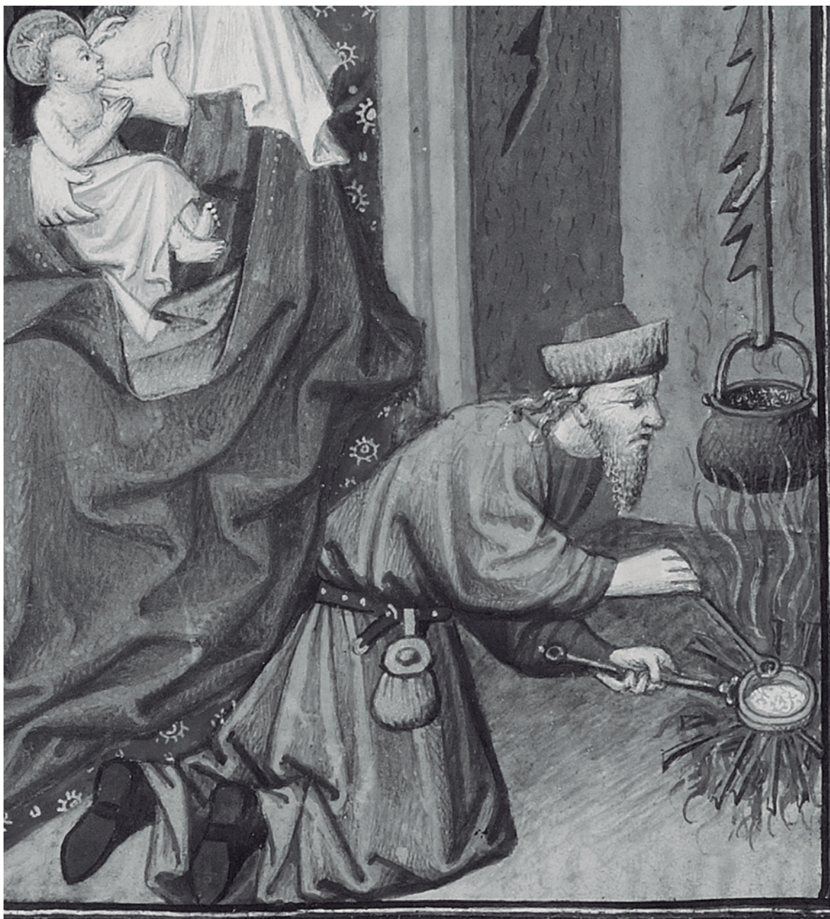
Fig. 3. Paul Getty Museum, Ms. Ludwig IX 6 (detalle). Libro de horas. 1440-1450.