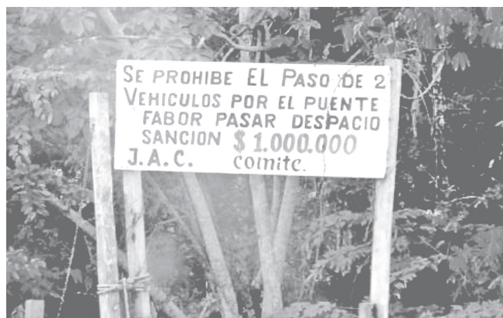
Foto 1. Normas comunitarias.