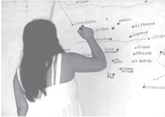
Foto 9. Dibujando el Yari.

mundo), Mimesis II es el momento en que se evidencia la construcción de este relato histórico que justifica la existencia de otro ordenamiento jurídico en el Yari. Es decir, es el momento en que se presenta la articulación de todas estas narraciones de la vida cotidiana de la región en un relato coherente que da sentido a los habitantes de esta zona y que da un orden narrativo a sus vidas. Así, en términos de Ricoeur: