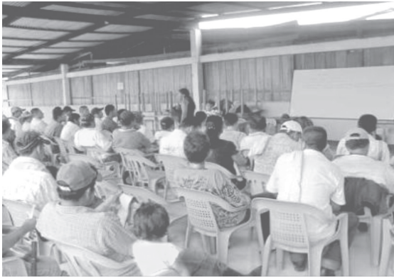
Foto 8. Reunión de Campesinos Corpoayari.

primera vez la amazonia occidental no podía comprender muchas de sus dinámicas, ya que no manejaba la red conceptual que une acción y palabra en esta región, para ejemplificar este hecho un trozo de diario de campo.