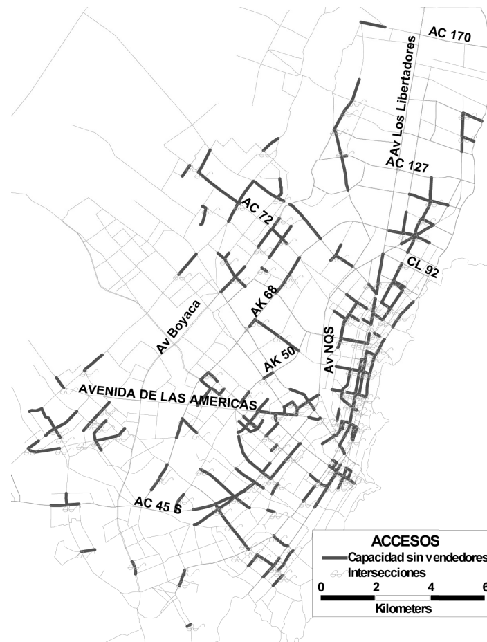
Gráfica 1. Tramos afectados por los vendedores ambulantes.

En la gráfica 1 se aprecian los corredores afectados por vendedores ambulantes, los cuales corresponden a 270 arcos de la red tesis compuesta por 1.950 arcos para el periodo de calibración 2001, los cuales corresponden al 13,85% de los arcos de la red tesis.