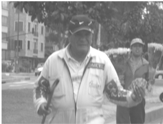
Foto 1. Vendedores ambulantes.

En la foto 1 se aprecia la forma de presentación de los productos. La información recolectada se plasmó en una base de datos, donde se cruzó la información entregada por la Secretaría de Tránsito y Transporte, gráfica y datos, y el inventario de vendedores que se recolectó en campo. La base de datos se desarrolló en Access y la parte gráfica en Arcview.