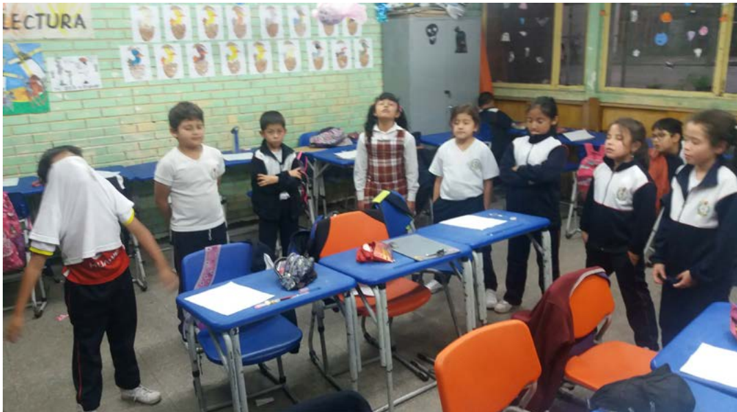
Figura 3. Mapa corporal de sentimientos y emociones.

misma como interés. Muchas veces la expresión de los niños y las niñas se cohibe tras no considerarla como esencial. Sin embargo, sus vidas salen a la luz de la realidad mediante sus comportamientos, historias y creaciones artísticas, compartidas algunas veces a sus compañeros por el vínculo y entendimiento que se dan entre algunos de ellos. Nuevamente se reafirma que la búsqueda social se da de acuerdo con similitudes estéticas para el goce y la satisfacción de lo que hacen o producen.