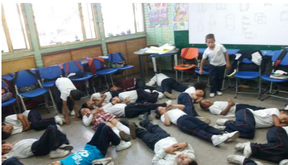
Figura 1. Reconocimiento del cuerpo propio.