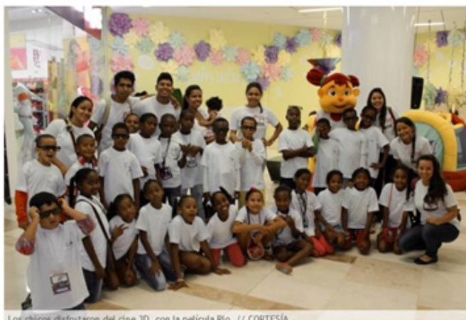
Imagen 1. Visita a las salas de CINELAND Cartagena. Por primera vez los niños de cinecitos asisten a una sala de cine