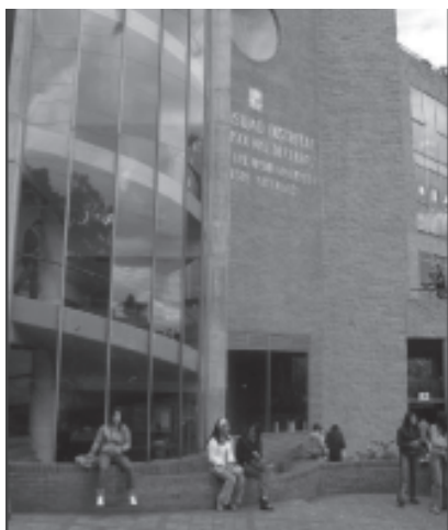
Facultad de Medio Ambiente

alumno. ¿Cuáles son las competencias que debemos desarrollar? ¿Qué tipo de actividades lingüísticas y discursivas se espera que realice un alumno en un ámbito escolar? ¿Cómo nos convertimos, desde el punto de vista pragma-lingüístico, en alumnos? ¿Qué características son asociadas con los buenos alumnos? ¿Cuáles son las características asociadas con los denominados malos alumnos? Estas son algunas de las preguntas que deseamos responder.