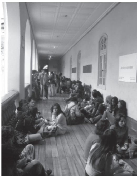
Facultad de Artes

En todo caso, quizás por el tamaño de la universidad y el reducido número de sus estudiantes, estos trastornos apenas si eran registrados en pequeñas columnas perdidas en los últimos renglones de la respectiva edición de los diarios; en contraste, las manifestaciones de universidades como la Nacional, la de Caldas, la de Cartagena eran destacadas en los mismos medios. Y pareciera mantenerse esa tendencia, porque todavía hoy las “pedreas” de la Distrital no resultan ser tan llamativas como las de otras universidades públicas, como la Nacional o la Pedagógica, en Bogotá.