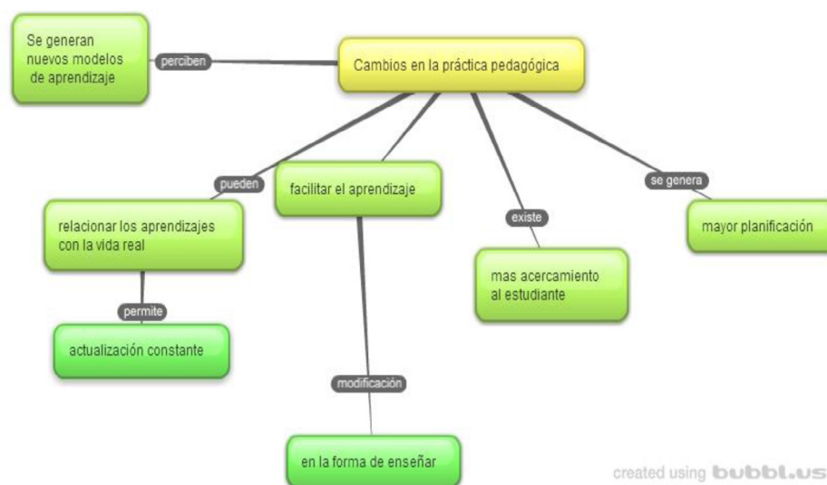
Figura 3. Cambios en la práctica pedagógica

Antes de la especialización trabajaba con TIC pero la especialización me abrió la visión, me dio nuevas estrategias de enseñanza... de enseñanza-aprendizaje, me generó una nueva, me creo nuevas metodologías de aprendizaje no siendo tan tradicional y lo bueno es que hace que cada uno de los estudiantes sea mucho más creativo al momento de entregar las actividades, entonces no me cierro a la presentación de las evidencias sino que cada quien, cada estudiante, pueda hacer su propio diseño en la plataforma que sea, sea plataforma web, sea plataforma aquí en el servidor, lo importante es que se entreguen las actividades de la mejor manera y bajo los requerimientos que se están solicitando. [Docente entrevistado]