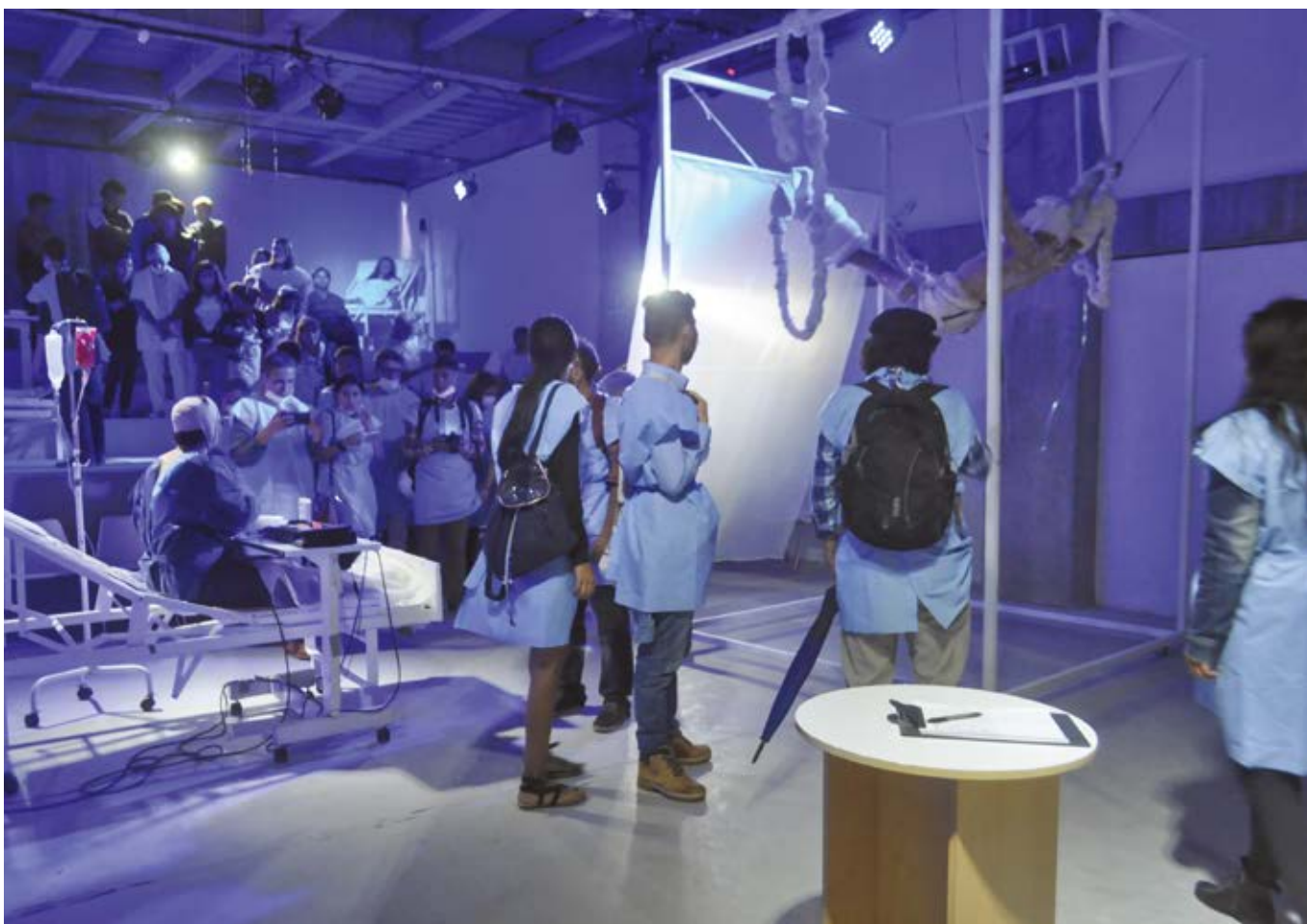
Imagen 8. Acción performática "El Fajadito".

culmina, como cuando canta en entresueños con Liza Minelly "Life is a cabaret":