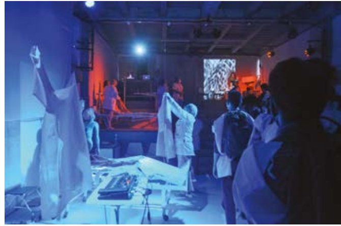
Imagen 2. Espacio Escénico —UCI—.