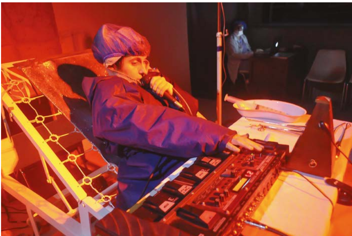
Imagen 10. Acción Performática Hipócrates Anestesiado .

independientes: dos frontales, derecha (D) e izquierda (I); un centro (C), y dos envolventes, derecha atrás (DA) e izquierda atrás (IA). Este sistema de audio multicanal permite tanto, ubicar sonidos específicos en puntos fijos del escenario, como que el sonido se mueva entre los cinco ejes de reproducción, generando un sonido envolvente. El sonido y su espacialización, su sensación de giro, juegan un papel relevante en el propósito del performance de provocar en el espectador, en su rol de visitante de una UCI, una serie de afectaciones que incentiven su percepción de habitar un espacio real que lo contiene. La especialización del sonido también incrementa la percepción de laterales en el espacio habitado, que es a la vez circunscrito por el movimiento de las imágenes proyectadas. Surge de cada esquina del escenario una luz distinta, un sonido distinto, todo el ambiente pareciera rodearse del bip-bip constante y casi rítmico del monitoreo de cada afección, pero al escuchar con más detalle se escuchan casi silentes las gotas que caen de una bolsa de suero, más allá los quejidos que se confunden con el ruido de un respirador, en el fondo el sonido trastornado que circula como los