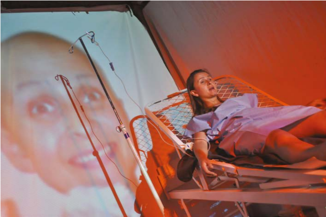
Imagen 6. Acción performática, La mirada autobiográfica .

tierra, con los instintos; por otro lado, está la imagen del pájaro, que se conecta con los otros planos ancestrales. Cuando el pájaro se va del cuerpo, este muere, mientras que el jaguar puede ir y volver con pedazos en diferentes planos. Estas dos imágenes tensionan el cuerpo del personaje y de la actriz al punto que expulsan sus yerros, sus deslices y sus transgresiones.