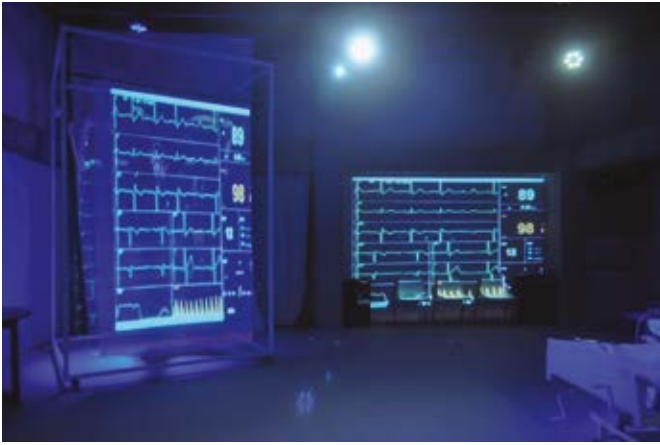
Imagen 1. Entorno Digital.