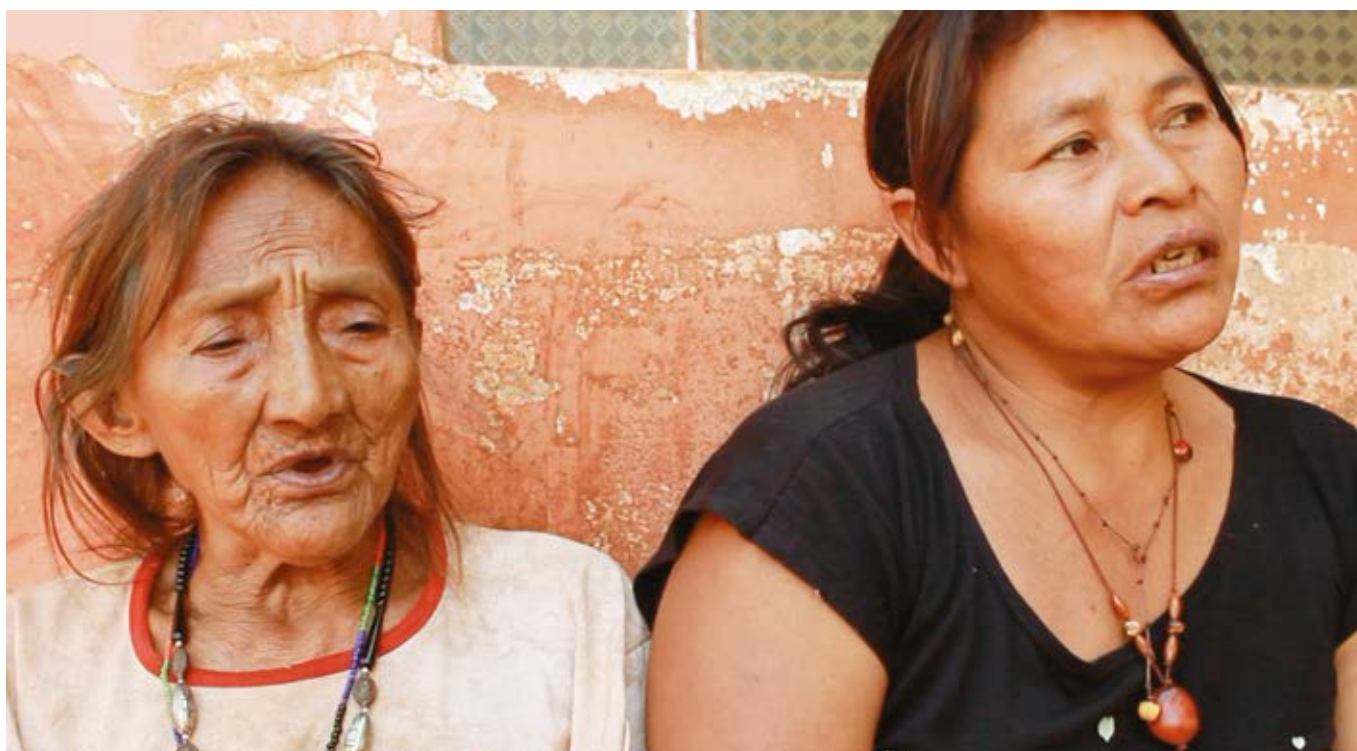
Imagen 4. Cantadoras indígenas Guaraní.

Es por lo anterior, que, la directora teatral, Echenique retoma el juramento de Hipócrates, ese compromiso profesional de la defensa y protección de la vida que realizan los médicos, y lo cuestiona, en tanto lexicalidad que ha perdido su sentido en una repetición formalizada. En este sentido, se refuerza el concepto de "somos cuerpo" dejando de lado el "tenemos cuerpo". El tener, tal como lo menciona Tomás Maldonado (1998), instalaría un pensamiento de posesión y que, por tal razón, estaríamos en la capacidad de hacer de él lo que queramos o, mejor, lo que podamos. Por el contrario, pensar en que "somos" cuerpo, habilita la posibilidad de concebir este como "sensorialidad, sensibilidad y