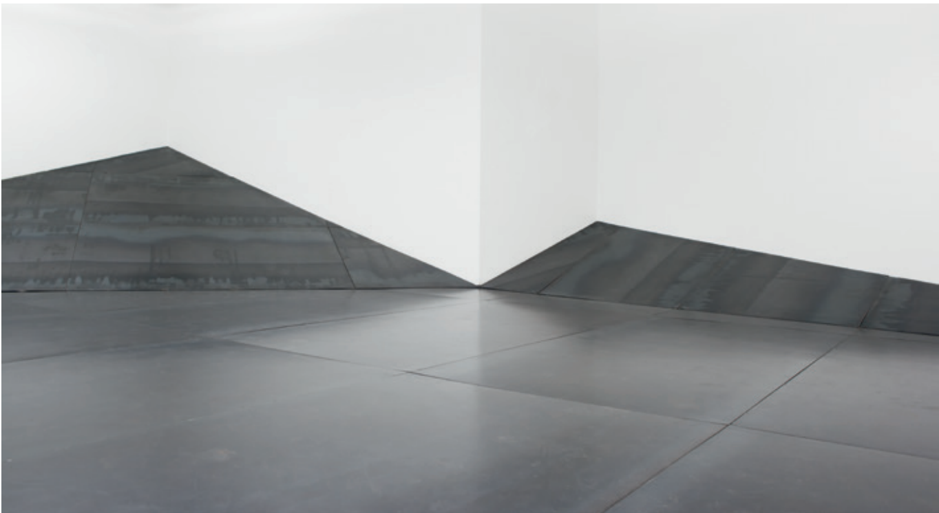
Mundo , (John Castles 2011), acero soldado, 36 m 2 , Galería Mundo.

Eduardo Serrano. “Sinuosas” Bogotá. Cámara de Comercio, Abril de 2009.