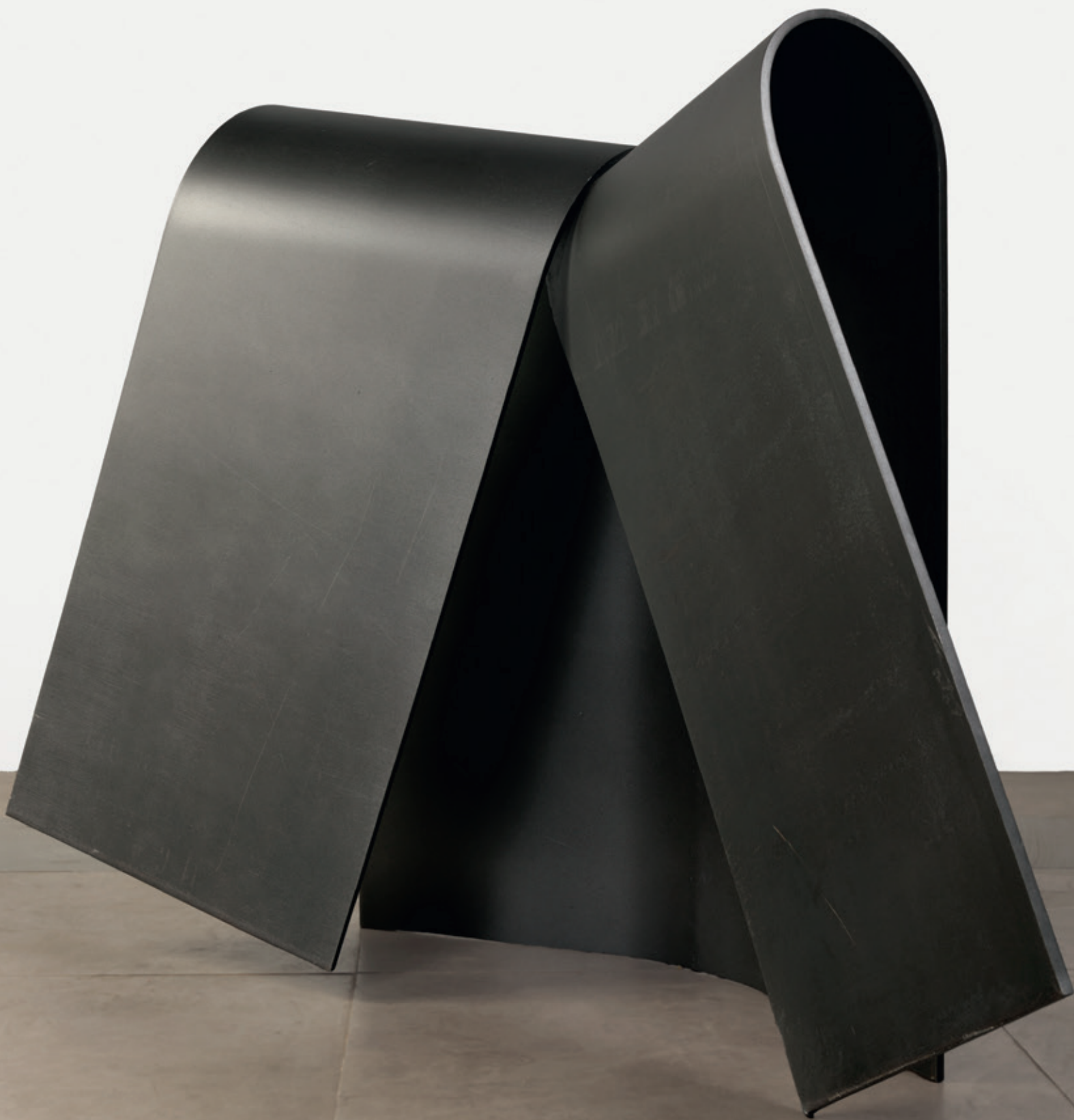
Abierto frontal , (John Castles 2015), acero, 88 x 115 x 70 cm.