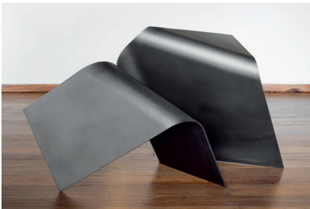
Perpendicular , (John Castles 2011), acero, 79 x 105 x 95 cm.