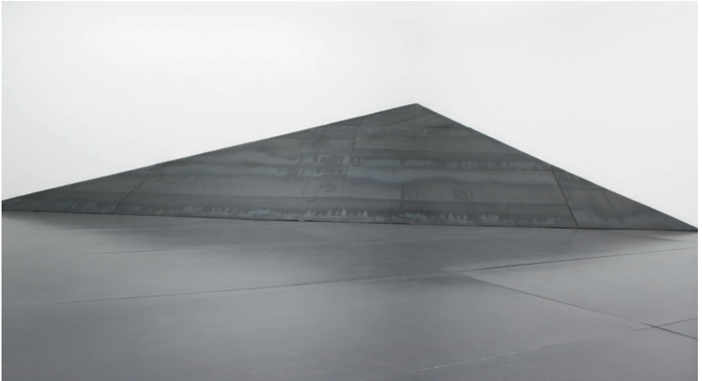
Mundo , (John Castles 2011), acero soldado, 36 m 2 , Galería Mundo.