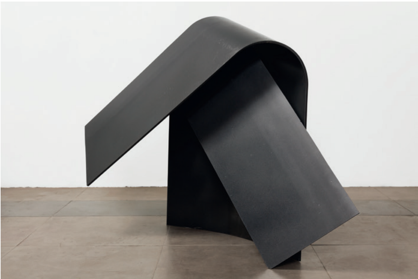
Cruzado frontal , (John Castles 2016), acero, 93 x 40 x 130 cm.

Bogotá. ArtNexus No.142, pg. 44-49, Marzo - Mayo 2015.