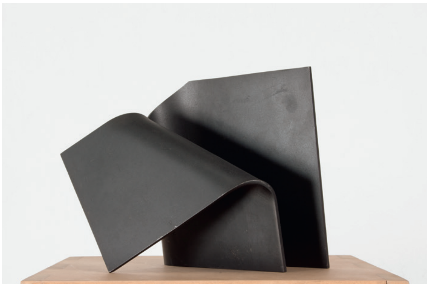
Perpendicular (John Castles 2010) acero, 16 x 23 x 32 cm.