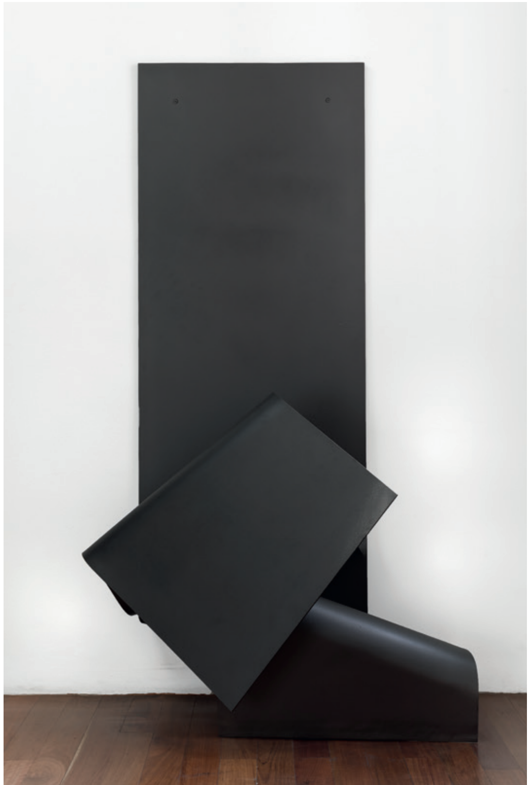
Cruzada , (John Castles 2017), acero soldado, 165,5 x 58 x 90 cm.