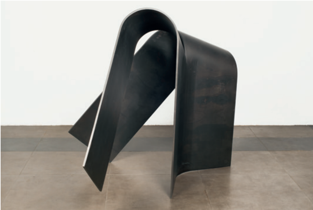
Abierto posterior , (John Castles 2014), acero cm.