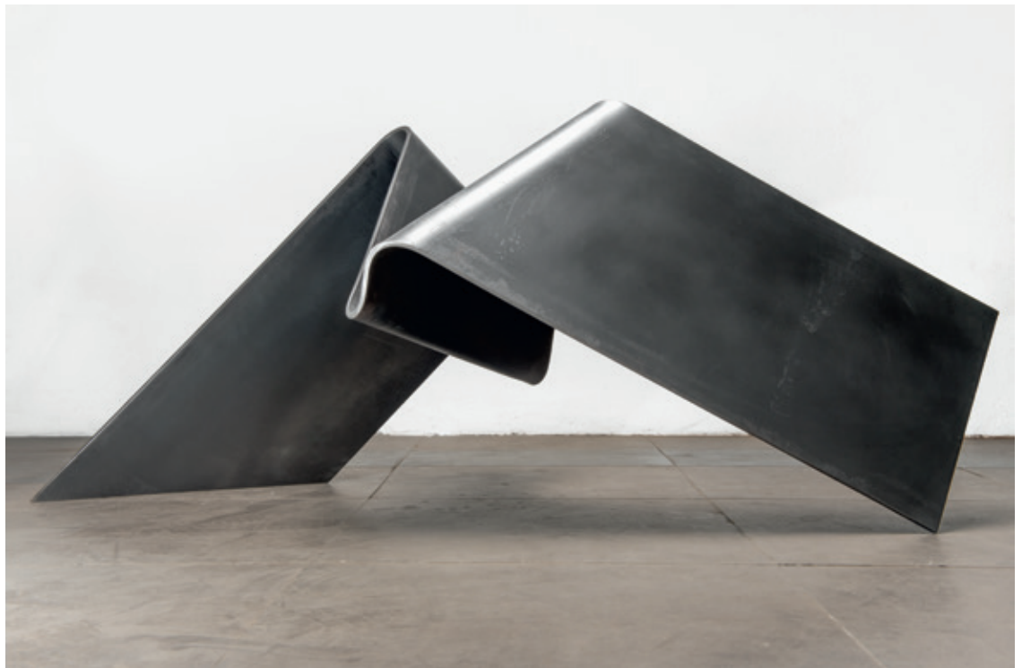
Paralelo , (John Castles 2014), acero, 67 x 98 x 135 cm.