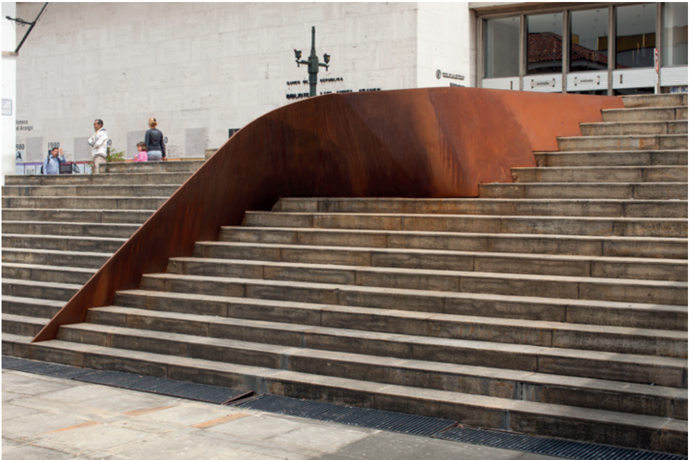
Escalonada , (John Castles 2016), acero, 297 x 515 x 472 cm, Museo de Arte Miguel Urrutia, MAMU.