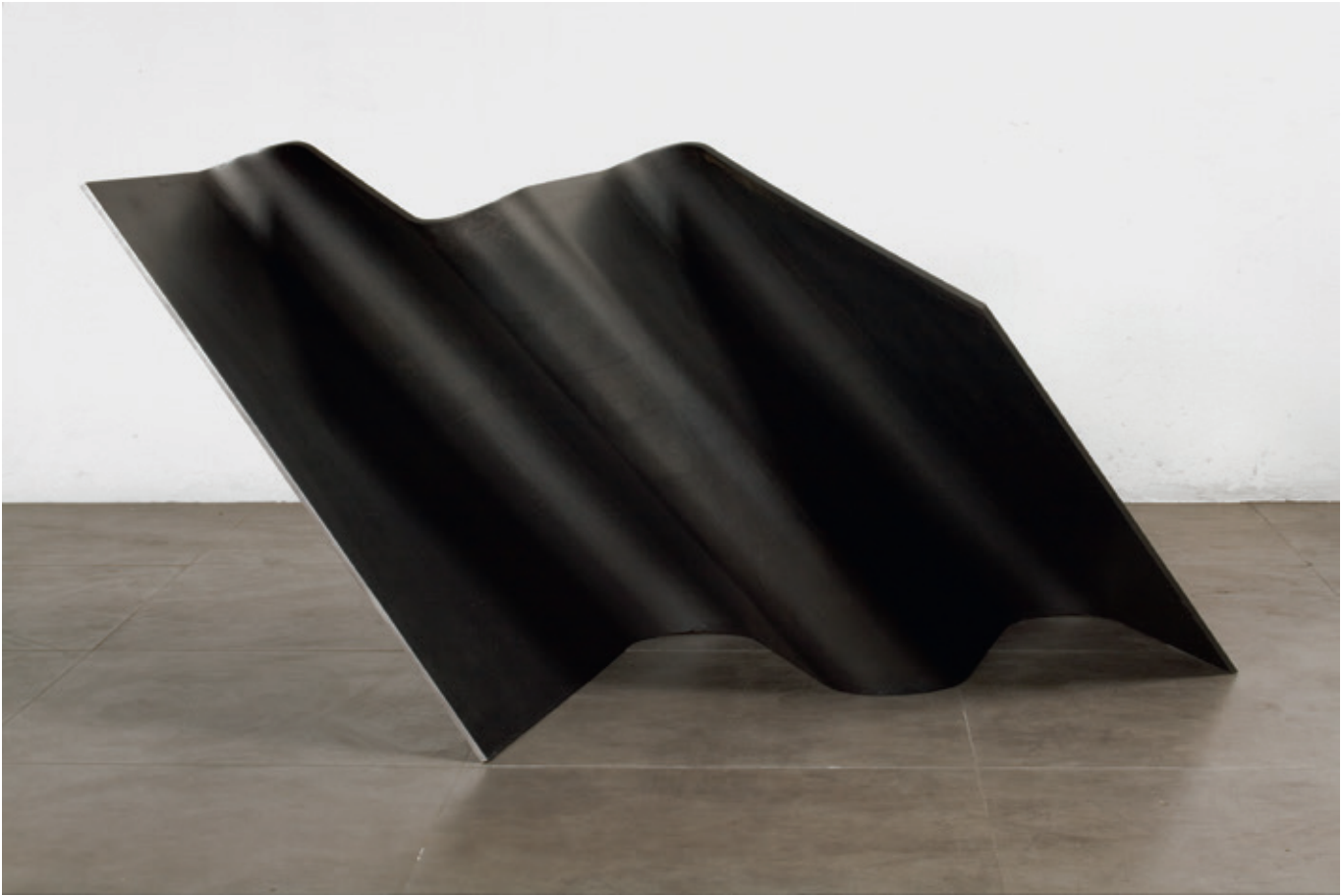
Triple 2 , (John Castles 2009), acero, 70 x 86 x 92 cm.