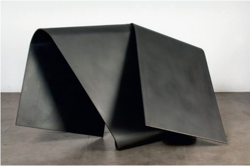
Envolvente horizontal 3 , (John Castles 2008), acero, 85 x 125 x 56 cm.