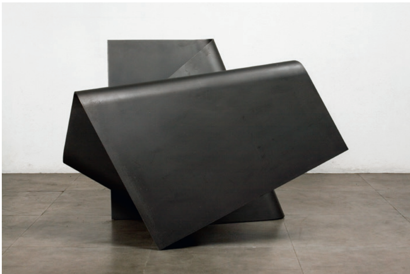
Horizontal , (John Castles 2008-09), acero, 89 x 75 x 120 cm.

Luis Fernando Valencia. “John Castles” Bogotá. Alonso Garcés Galería, Agosto, 2008.