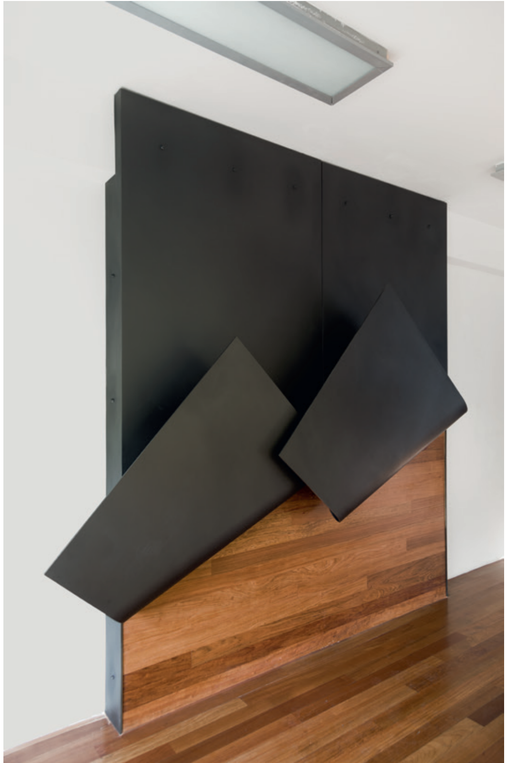
Ascendente , (John Castles 2017), acero y madera, 279 x 278 x 47 cm.