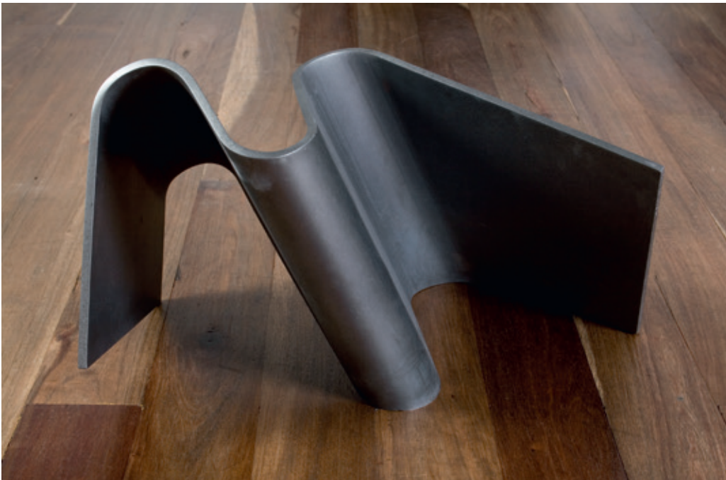
Triple diagonal , (John Castles 2008), acero, 38 x 60 x 48 cm.