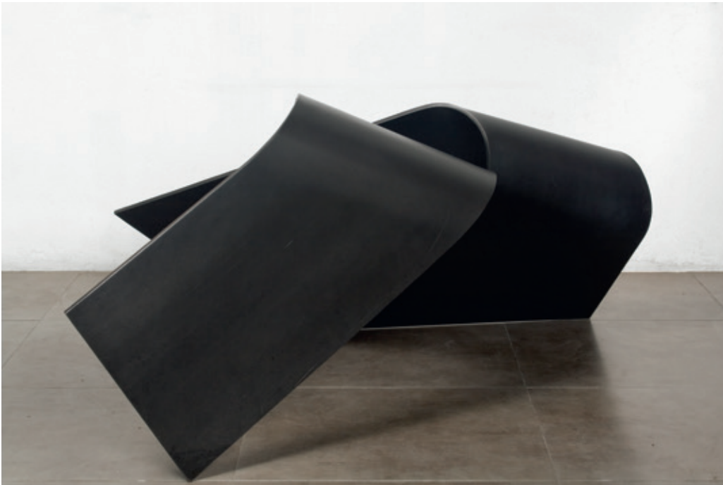
Rajada 2 , (John Castles 2009), acero, 70 x 142 x 126 cm.