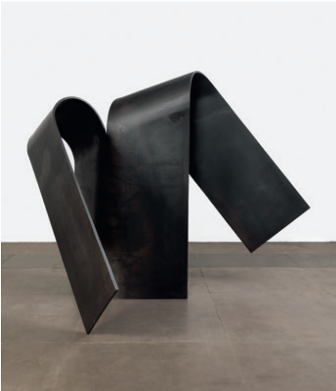
Diagonal alterno , (John Castles 2014), acero, 110 x 77 x 120 cm.