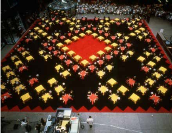
▲ Figura 5. Suzanne Lacy. Crystal Quilt , 1987. Escena perteneciente a la acción realizada por más de 430 mujeres en Minneapolis, 1987.