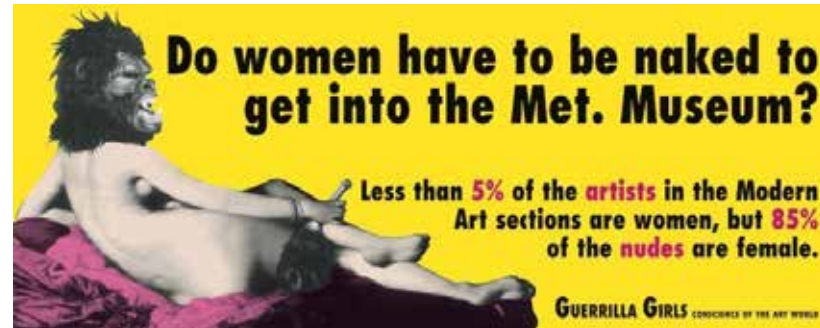
▲ Figura 4. Guerrilla Girls. Cartelería presentada en la Bienal de Venecia, 2005.

[¿Por qué las mujeres tienen que estar desnudas para entrar en el Museo? Menos del 5% de los artistas en las secciones de arte moderno son mujeres, pero el 85% de los desnudos son femeninos.]