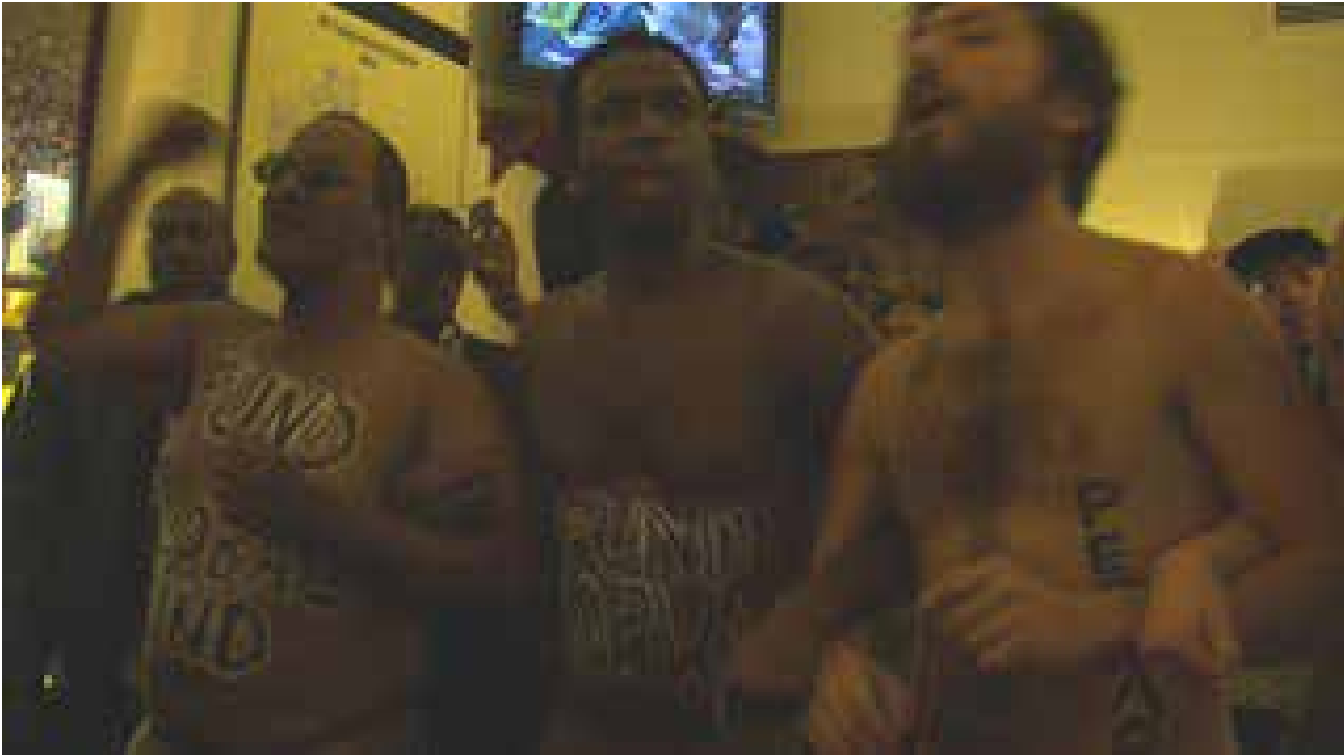
▲ Figura 2. ACT UP. Acción en la Cámara de Representantes de EE.UU en contra de los recortes presupuestarios de los programas nacionales y mundiales sobre el sida, 2012.