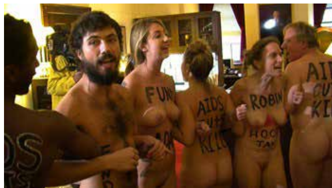
▲ Figura 1. ACT UP. Acción en la Cámara de Representantes de EE.UU en contra de los recortes presupuestarios de los programas nacionales y mundiales sobre el sida, 2012.

y así poder alcanzar todas aquellas políticas necesarias que permitan paliar la enfermedad. Una de las últimas acciones (figuras 1 y 2) consistió en ingresar totalmente desnudos, con inscripciones en sus cuerpos, en la oficina del Presidente de la Cámara de Representantes de EE.UU, John Boehner, con el objetivo de detener los nuevos recortes presupuestarios en los programas nacionales y mundiales sobre el sida.