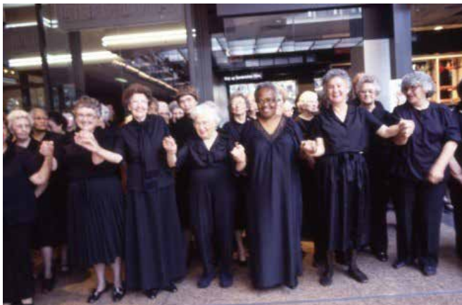
▲ Figura 6. Suzanne Lacy. Silver Action , 2013. Mujeres mayores de 60 años que desarrollan la acción propuesta para el BMW Tate en vivo, Londres, 2013. Fotografía de Suzanne Lacy