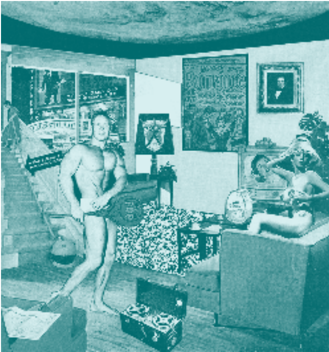
◀ “Just What Is It That Makes Today's Home so Different, so Appealing?” Richard Hamilton, Collage 1956. (Kunsthalle Museum, Tübingen, Germany)

su predestinación de pobres, artesanos y gremios. La prueba de esta distinción es patente en la fundación en 1561, por el propio Vasari, de una institución en Florencia que prolongará sus intenciones periodísticas divinizantes: la Accademia del disegno . Surge así el modelo académico en las artes visuales, uno muy anterior a otros modelos académicos establecidos posteriormente durante el reinado de Luis XIV, como el medicinal, el de la jardinería, el arquitectónico o el de moneda. El modelo académico visual fue un modelo muy usado por todo régimen absolutista subsiguiente, desde el de Luis XIV, pasando por Napoleón, Hitler y Stalin, hasta el de dictadores latinoamericanos como Trujillo o Videla, aunque en estos dos últimos se manifestó como asesinato o censura más que como arte estatal. Por un tiempo el legado de Vasari no fue muy popular, y su continuación se debe a Federico Zuccaro, cuando este abrió en 1593 la Academia San Lucas de Roma, usurpada prontamente por el papado, que logró exportar el modelo divinizante rápidamente a Francia. Con la fundación en 1648 de la Real Academia de Pintura y Escultura en París, durante el reinado de Luis XIV, el modelo creativo divino se extendió por toda Europa, comenzando por Londres (1707) y Madrid (1752), expandiéndose virulentamente por América en México (1785) y Filadelfia (1805), y terminando tardíamente en Bogotá (1886), y luego, en pleno siglo XX, en China (1928) y otros lugares.