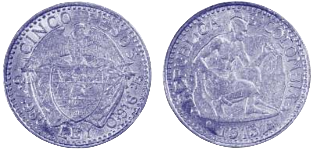
▲ "Moneda del Minero", bajo relieve en bronce, Francisco Antonio Cano, 1913.