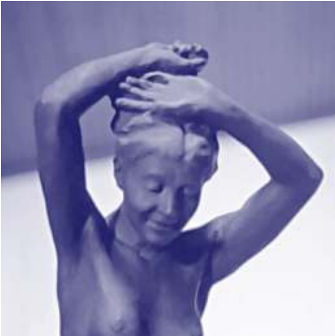
◀ "La sima", proyecto en barro, Francisco Antonio Cano, colección particular.

en oro y plata de cinco y dos pesos. Los cuños se trabajaron en Inglaterra sobre dibujos de Cano ( El Gráfico , 1912: 4, 7). Contenían en el anverso la emblemática figura de un minero, la leyenda "República de Colombia" y la fecha, y en el reverso el escudo nacional. El motivo de la emisión de estas monedas, que circularon por toda Colombia, fue la conmemoración del Centenario de la Independencia de Antioquia en 1913. Cano escogió la figura del minero como símbolo del trabajo, y se opuso a las imágenes de la Patria o de la Paz, por considerarlas pasadas de moda. Ideó además un medallón en bronce con la figura del "Minero", una ampliación del cuño diseñado para las monedas. De estilo simbolista son igualmente un medallón de bronce con la figura de una niña, y las esculturas "El abismo" y "La sima".