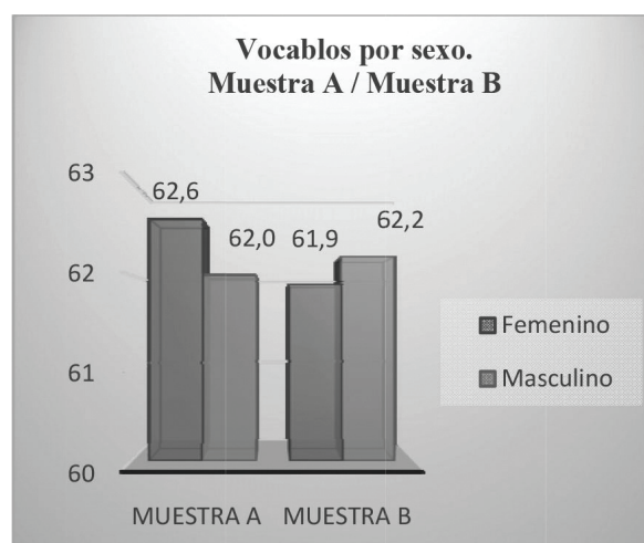
Figura 1. Vocablos por sexo.

El análisis de cada sexo por separado arroja que el uso de PCN por texto en la muestra A es superior en las niñas al de la muestra B, ya que el intervalo de aparición es menor (1,92 frente a