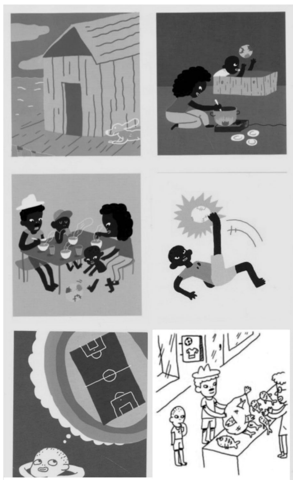
Figura 3. Lectura de Tumaco realizada en el taller 3 de la etapa de fundamentación.