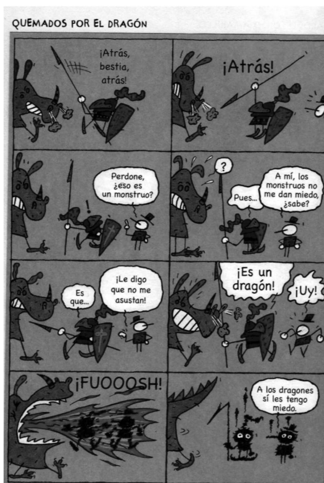
Figura 4. Lectura realizada en el taller 5 de la etapa de fundamentación.