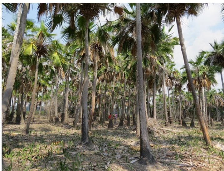
Figura 3. Población de C. tectorum en Plato, Depresión Momposina.

Hace unos 20 años el aprovechamiento de la palma no tenía ningún requisito legal, pero actualmente el régimen sobre aprovechamiento forestal, Decreto 1791 de 1996 (MMA, 1996), determina que todos los usuarios de productos de la flora silvestre deben obtener un permiso de aprovechamiento para poder extraer estos recursos si