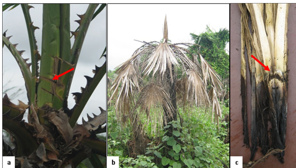
Figura 4. Corte inapropiado de cogollos de C. tectorum en Magangué, Depresión Momposina. (a) La flecha señala daños generados por malos cortes anteriores. (b) Palma muerta posiblemente por un mal corte. (c) Evidencia de mal corte en meristemo de palma muerta.

En cuanto al impacto de la cosecha a nivel cuantitativo se encontró que las palmas cosechadas de la clase juveniles 3 en Magangué tenían significativamente menos hojas que las de la misma clase (no cosechada) en Plato ( x=3.6 ; DS=1.89 ; n=221 y x=18.2 ; DS=8.88 ; n=11 , respectivamente;