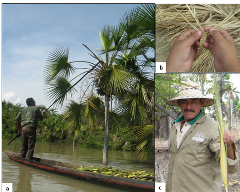
Figura 1. Uso de C. tectorum en la Depresión Momposina. (a) Cosecha de cogollos. (b) Trenzado de la fibra extraída de los cogollos. (c) Recolector mostrando un cogollo y usando el sombrero que es el producto más importante elaborado con esta fibra.

Para describir el manejo se tuvo en cuenta los niveles de análisis propuestos por Ticktin (2004), que incluyen la forma o técnica de cosecha, las prácticas de manejo locales y el uso del suelo o cobertura vegetal en donde crece el recurso; esta información se complementó con otras variables que se consideran importantes para evaluar y formular el manejo sostenible, como el régimen de uso, la forma de tenencia de la tierra, el acceso al recurso y otros factores de amenaza sobre el recurso o el ecosistema diferentes al uso artesanal (Galeano et al. , 2010). El impacto de la cosecha se abordó de forma cualitativa, mediante la observación de los palmares, pero también de forma cuantitativa a través de la comparación de las variables número de hojas/palma, longitud de los cogollos y estructura de la población entre individuos y poblaciones cosechadas y no cosechadas.