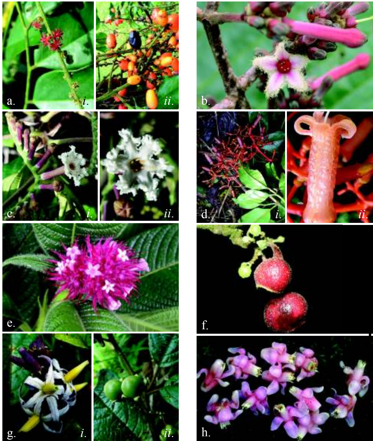
Figura 4. a. SIMAROUBACEAE. Picramnia sphaerocarpa . i. Flores. ii. Frutos. b. RUBIACEAE. Cinchona pubescens . Flores. c. RUBIACEAE. Guettarda crispiflora . i. Rama fértil. ii. Flor. d. RUBIACEAE. Palicourea demissa . i. Rama fértil. ii. Flor. e. RUBIACEAE. Psychotria erythrocephala . Inflorescencia. f. SIPARUNACEAE. Siparuna lozaniaza . Frutos. g. SOLANACEAE. Solanum anceps . i. Flores. ii. Frutos. h. SYMPLOCACEAE. Symplocos serrulata . Flores.