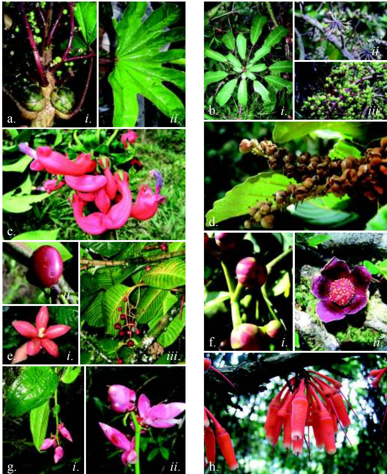
Figura 2. a. ARALIACEAE. Oreopanax palamophyllum . i. Rama fértil. ii. Hoja. b. ARALIACEAE. Schefflera elachistocephala . i. Hoja. ii. Inflorescencia. iii. Frutos. c. CAMPANULACEAE. Centropogon solanifolius . Inflorescencia. d. CLETHRACEAE. Clethra fagifolia . Frutos. e. CLUSIACEAE. Chrysochlamys clusiifolia . i. Fruto. ii. Fruto dehiscente. iii. Rama fértil. f. CLUSIACEAE. Clusia bracteosa . i. Flores en botón. ii. Flor. g. ERICACEAE. Cavendishia compacta . i. Rama fértil. ii. Inflorescencia. h. ERICACEAE. Psammisia penduliflora . Inflorescencia.