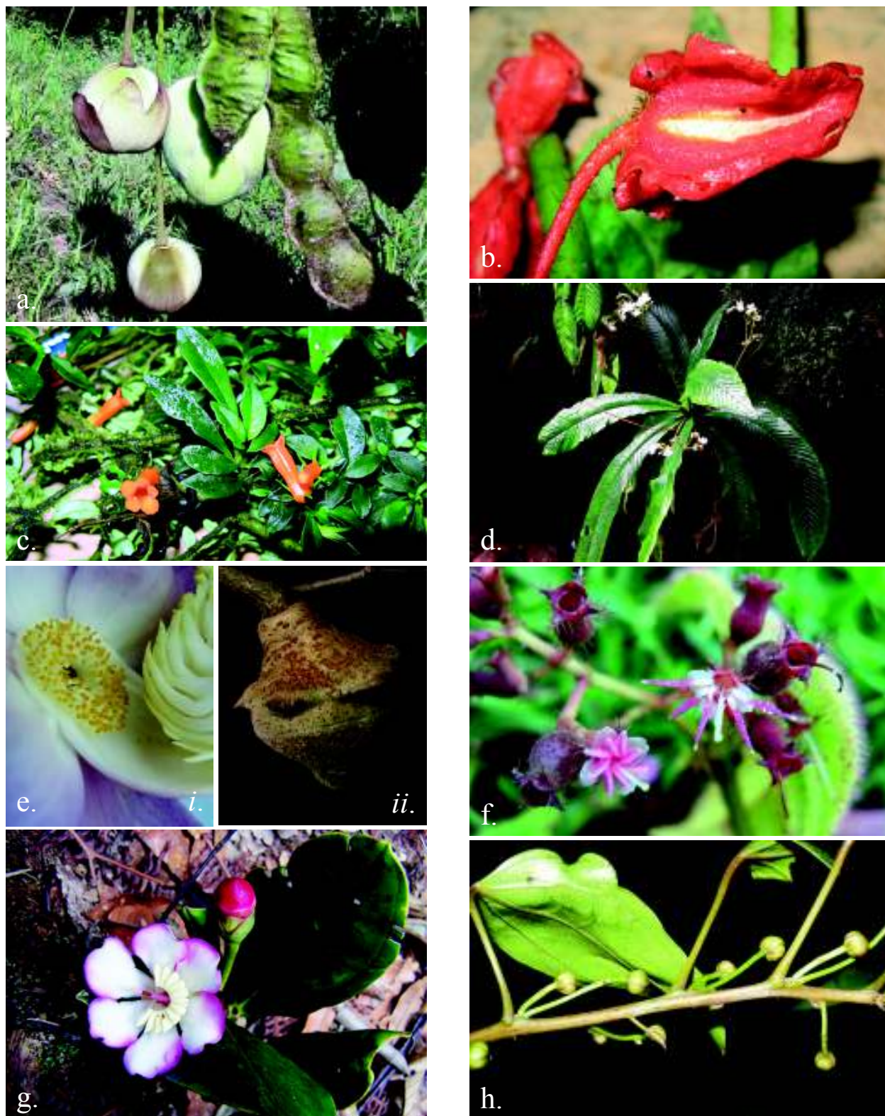
Figura 3. a. FABACEAE. Mucuna holtonii . Flores en botón y frutos. b. GESNERIACEAE. Alloplectus ichthyoderma . Rama fértil. c. GESNERIACEAE. Besleria fallax . Botón floral. d. GESNERIACEAE. Resia ichthyoides . Habito. e. LECYTHIDACEAE. Eschweilera sessilis . i. Detalle de la flor. ii. Fruto. f. MELASTOMATAACEAE. Acisanthera unifolia . Rama fértil. g. MELASTOMATAACEAE. Blakea quadrangularis . Rama fértil. h. MENISPERMACEAE. Anomospermum reticulatum . Rama fértil.