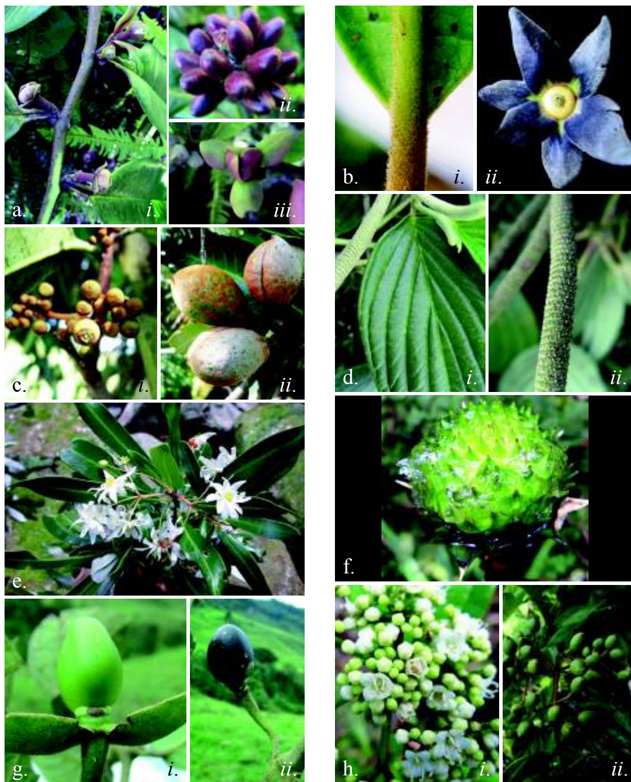
Figura 1. a. ANNONACEAE. Guatteria crassipes . i. Rama fértil. ii. Fruto. iii. Flor. b. ANNONACEAE. Guatteria cf. laurifolia . i. Indumento por envés. ii. Flor. c. MYRISTICACEAE. Virola macrocarpa . i. Frutos en botón. ii. Frutos. d. PIPERACEAE. Piper eriopodon . i. Rama fértil. ii. Inflorescencia. e. WINTERACEAE. Drimys granadensis . Rama fértil. f. BROMELIACEAE. Guzmania triangularis . Inflorescencia. g. MENDONCIACEAE. Mendoncia villosa . i. Fruto inmaduro. ii. Fruto. h. ADOXACEAE. Viburnum toronis . i. Inflorescencia. ii. Frutos.