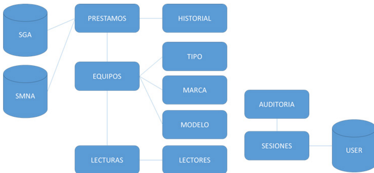
Figura 14. Modelo de base de datos.

La implantación del sistema con tecnología RFID en la biblioteca central de la UTM fue acertada, sustituyendo sin problemas al sistema de escritorio, agilizando el préstamo de los equipos electrónicos y proporcionando un mejor control frente al hurto. Todo esto hace de este servicio eficaz para aliviar la carga de trabajo de los bibliotecarios, incentivar a la comunidad universitaria y, en general, en incrementar la investigación y sumar al proceso de evaluación, acreditación y categorización de la UTM.