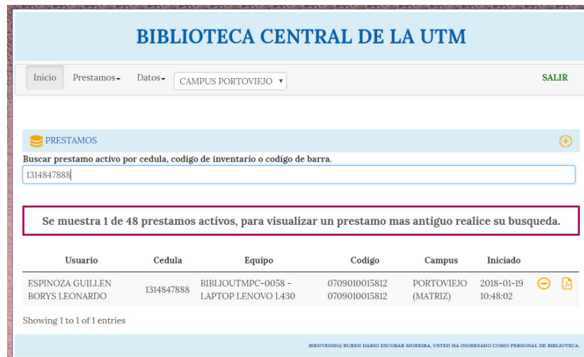
Figura 5. Ventana de administración de préstamos.