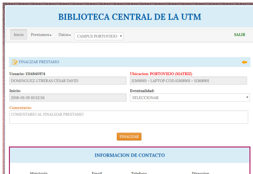
Figura 6. Ventana de finalización de préstamos.