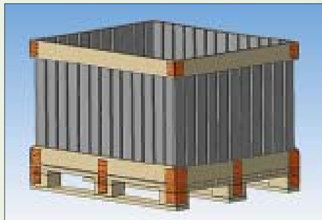
Рис. 1. Контейнер для сбора картофеля

Количество контейнеров, необходимых для убор-