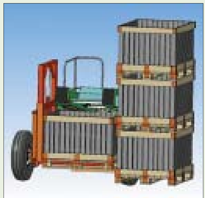
Рис. 3. Расположение порожних контейнеров на копателе Fig. 3. Empty containers placement on the digger

Разгрузочное средство для опускания грузеных контейнеров, смонтированное слева от копателя, имеет возможность поворачиваться на 90° в горизонтальной плоскости. Контейнер на вилах разгру-