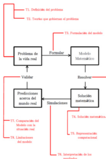
Figura 2. Ilustra el proceso de modelado matemático (negro) y un conjunto-T (rojo).