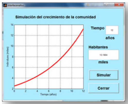
Figura 3. Interface para la simulación numérica del crecimiento de la población.

Para analizar el crecimiento de la población de la comunidad construir una interface gráfica como la que se ilustra en la figura 3. En esta es posible conocer el número de personas en un determinado tiempo. Los datos de entrada son los años y los datos de salida el número de personas en la comunidad.