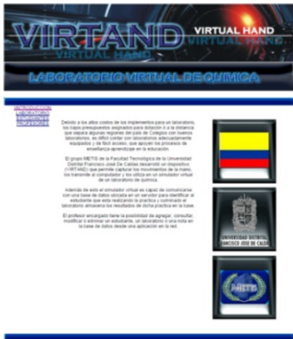
Figura 3: Pantalla de ingreso al laboratorio virtual de química para realizar prácticas en metales alcalinos.