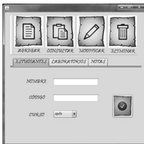
Figura 5: Opción para el docente dentro de la herramienta virtual.

Se debe aclarar que existe un administrador de la página, por lo general el rector de la institución educativa, quien codifica a los docentes. En la Figura 5 se muestra la página de los docentes.