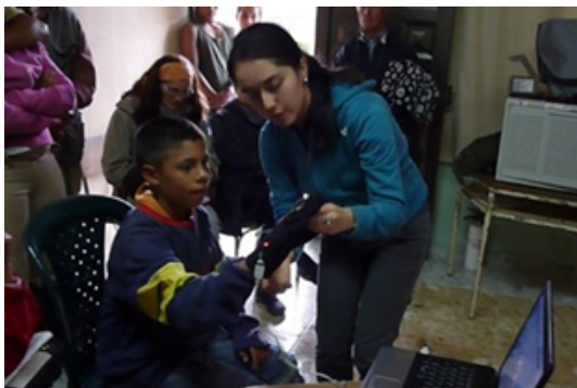
Figura 6: Pruebas con los estudiantes de la zona rural.