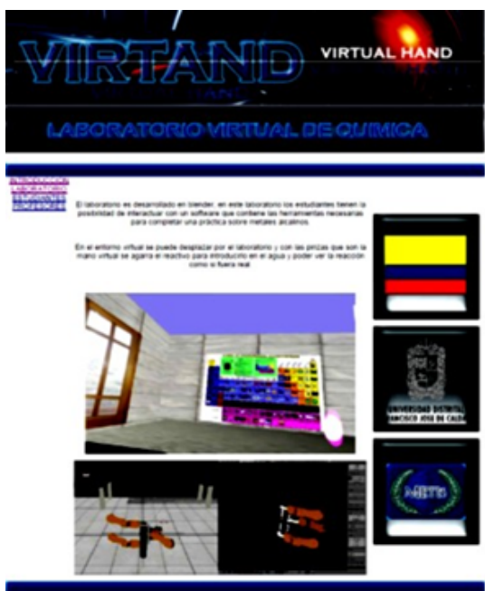
Figura 4: Página de los estudiantes para acceder a la práctica.