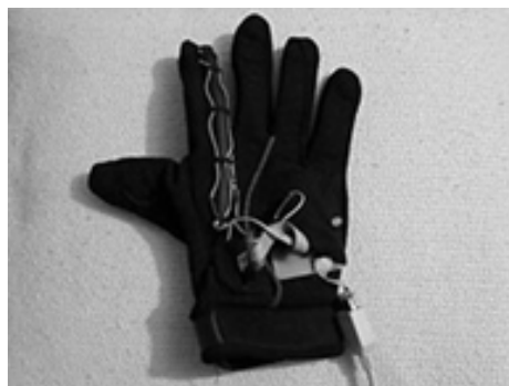
Figura 2: Foto de guante virtand desarrollado para realizar prácticas sobre metales alcalinos en un laboratorio virtual de química.

La herramienta obtenida es un guante que junto con un programa de simulación permite manipular elementos dentro de un laboratorio virtual de química con el fin de realizar prácticas de metales alcalinos. En la Figura 2 se muestra el guante virtand