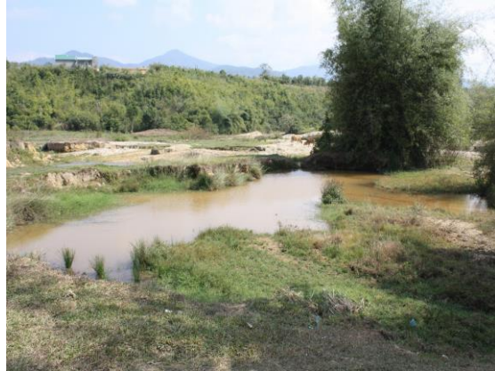
Ảnh 2. Khu ruộng cũ nay thành ao và hoàn toàn mất khả năng canh tác do khai thác vàng tại huyện Đăk Glêi - Kon Tum