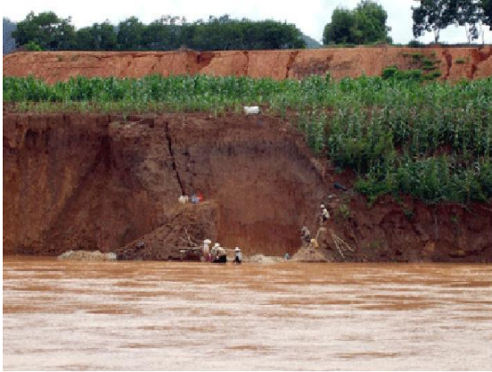
Ảnh 1. Sạt lở bờ sông Pô Cô do khai thác vàng trái phép