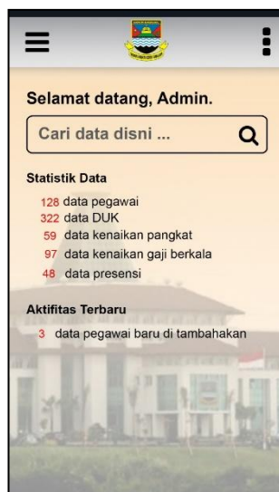
Gambar 3. Implementasi Halaman Beranda

Aplikasi m-Government di Diskominfo Kabupaten Bandung Barat untuk monitoring aktifitas aparatur sipil negara (ASN) yang telah diterapkan dilakukan pengujian dengan melalui beberapa responden sebagai sampel uji untuk menilai menguji kesesuaian aplikasi. Pengujian oleh responden ini melalui dua bagian yaitu mendata karakteristik responden dan statistika dari daftar pertanyaan-pertanyaan yang mewakili variabel yang di uji. Karakteristik responden dipetakan berdasarkan jenis kelamin, usia, jabatan dan pendidikan. Adapun kriteria responden secara rinci disajikan dalam Tabel 1.