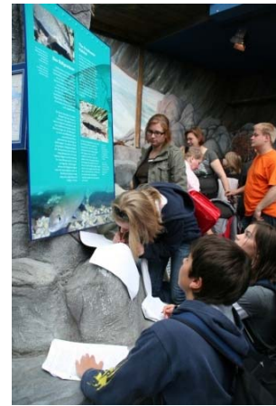
Abb. 1: Schüler bei der Beobachtung und Recherche der Tiere

Am Exkursionstag erhalten die Kinder nach Ankunft am Aquazoo eine „Karte“ vom Zoo und werden von der Lehrkraft in Kleingruppen von drei bis vier Personen eingeteilt. Diese Kleingruppen dürfen sich frei im Aquazoo bewegen. Hierbei sollen sie eigenständig die unterschiedlichen Meeresregionen erkunden und die dort lebenden Tiere beobachten (vgl. Abb. 1). Jedes Kind sucht sich schließlich ein Tier aus, zu dem es einen Steckbrief erstellt. Hierzu erhalten die Schülerinnen und Schüler zu Beginn der Freiarbeitsphase die bereits bekannte Steckbriefvorlage (vgl. M2), die mit den passenden Informationen ergänzt werden muss. Hierbei sollen die Kinder zunächst durch Beobachtungen an den lebenden Objekten den Steckbrief ausfüllen; die an den Aquarien vorhandenen Info-Tafeln können im nächsten Schritt die fehlenden Informationen ergänzen bzw. fehlerhafte korrigieren.