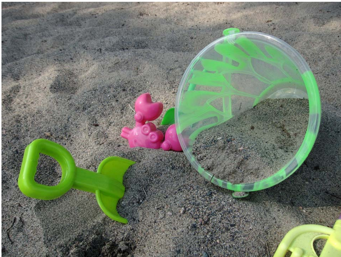
Abbildung 4: Plastikspielzeug am Strand