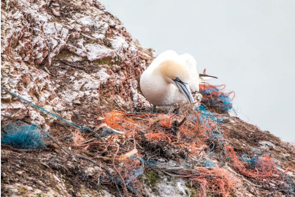
Abbildung 2: Basstöpel nutzt ein Netz für den Nestbau