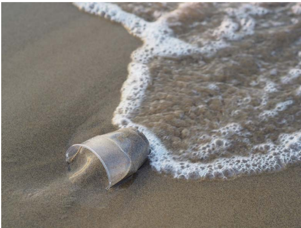
Abbildung 3: Plastikmüll am Strand