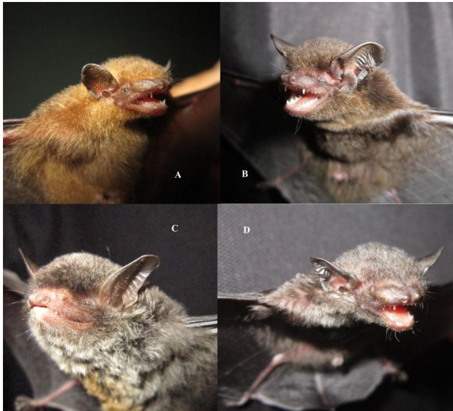
Hình 2. Hình ảnh một số loài dơi khu vực nghiên cứu: A. Tylonycteris fulvida , B. Hipsugo cadornae , C. Myotis annectans , D. Tylonycteris tonkinensis