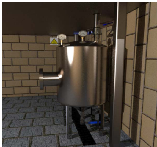
Figura 3 Tanque receptor.