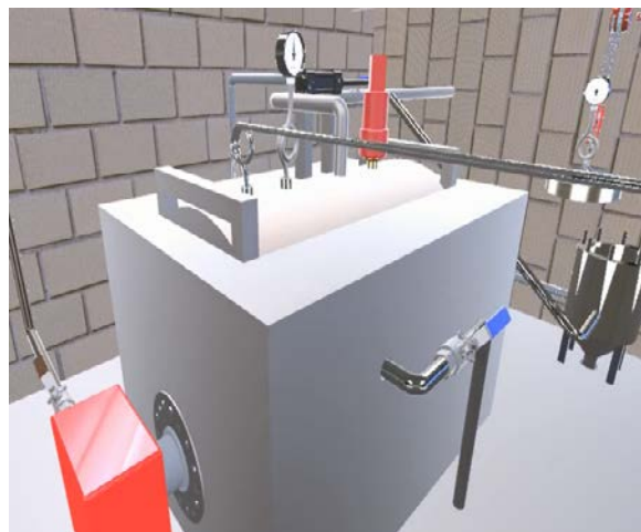
Figura 1 Fuente de vapor de explosión súbita de vapor.