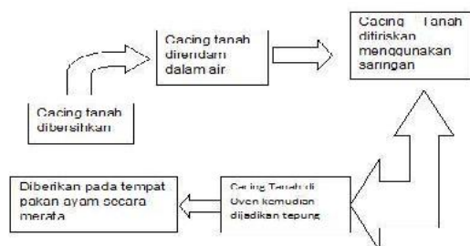
Gambar 1. Diagram Alir Pembuatan Tepung Cacing Tanah

cacing tersebut sudah dipastikan benar-benar sudah kering (kering oven) lalu diblender sampai menjadi tepung. Tepung cacing tanah tersebut lalu kemudian dcampurkan dengan ransum jadi (BP11) sampai benar-benar homogen. Berikut gambar alur proses pengolahan cacing tanah :