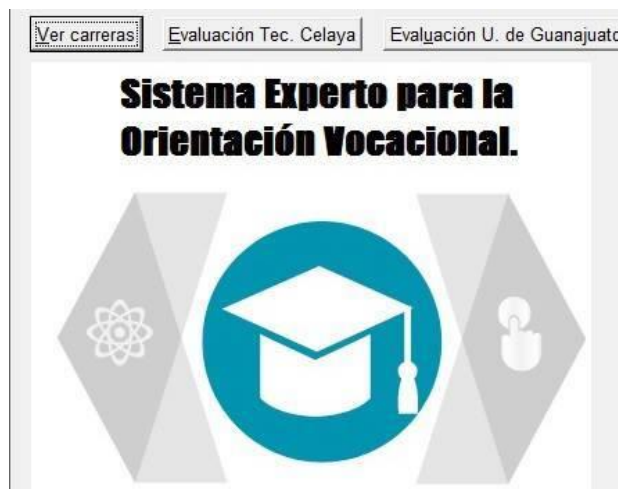
Figura 2.- Pantalla principal de Sistema Experto para la Orientación Vocacional.

Se desarrolló la siguiente interfaz gráfica para el Sistema Experto de Orientación Vocacional. En la figura 2 se muestra la pantalla principal del sistema experto, en donde se pueden ver las carreras y las opciones para comenzar el test de orientación vocacional para el ITC y la UG.