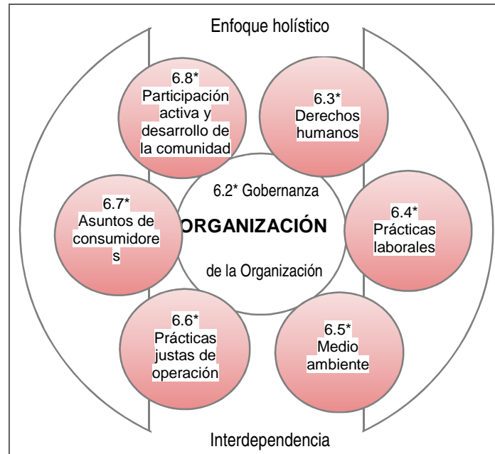
Figura 1. Responsabilidad Social: siete materias fundamentales

*La numeración indica el no. del capítulo en la Norma ISO 26000