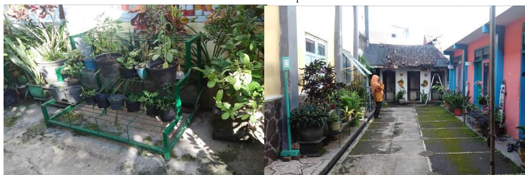
Gambar 2. (kiri) Taman dengan bentuk pot bertingkat, (kanan) foto lokasi taman tengah