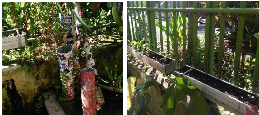
Gambar 4. Hasil karya siswa SLB berupa taman vertikal sayuran hasil dari kegiatan terapi okupasi

Tahap ini menandakan bahwa terapi okupasi akan berakhir. Guru dan anak mengumpulkan material (alat-bahan) bersama-sama dan mengadakan diskusi kecil tentang jalannya proses terapi okupasi.