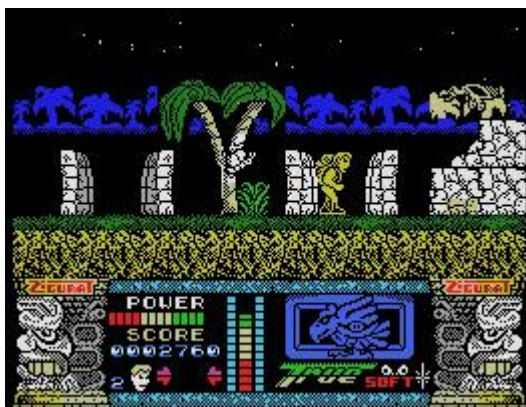
Acción en la jungla, según Jungle Warrior , 1990

La utilización de la cultura mediática del jugador para incrementar la calidad de la experiencia de juego ha sido una constante desde el nacimiento de los videojuegos. La escasa calidad visual de los primeros títulos obligaba a los desarrolladores a exprimir al máximo la imaginación del jugador para situarlos en un entorno creíble; para ello era necesario un proceso de “enajenación” voluntaria por parte del jugador que, gracias a los avances en informática gráfica de los nuevos títulos, casi ha desaparecido. Las dos imágenes que mostramos a continuación dejan clara esta evolución: