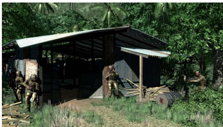
Acción en la jungla, según Crysis , previsto para 2007