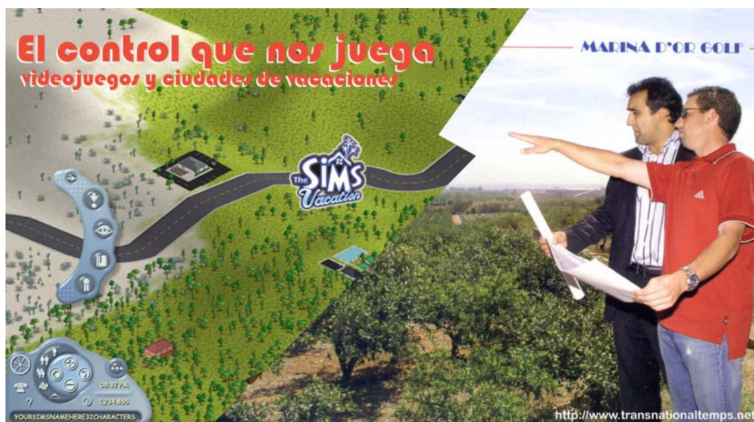
Analogía entre videojuego (virtual) y ciudades de vacaciones (real).