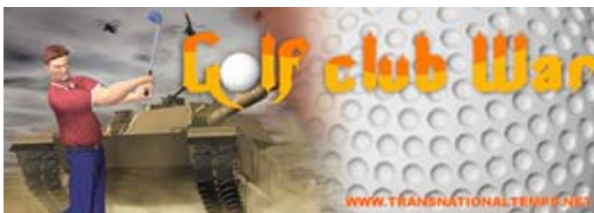
Golf Club War (vídeo)