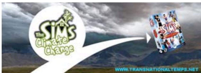
Sims Climate Change (vídeo)

http://www.transnationaltemps.net/spain/works/ccv/index.html