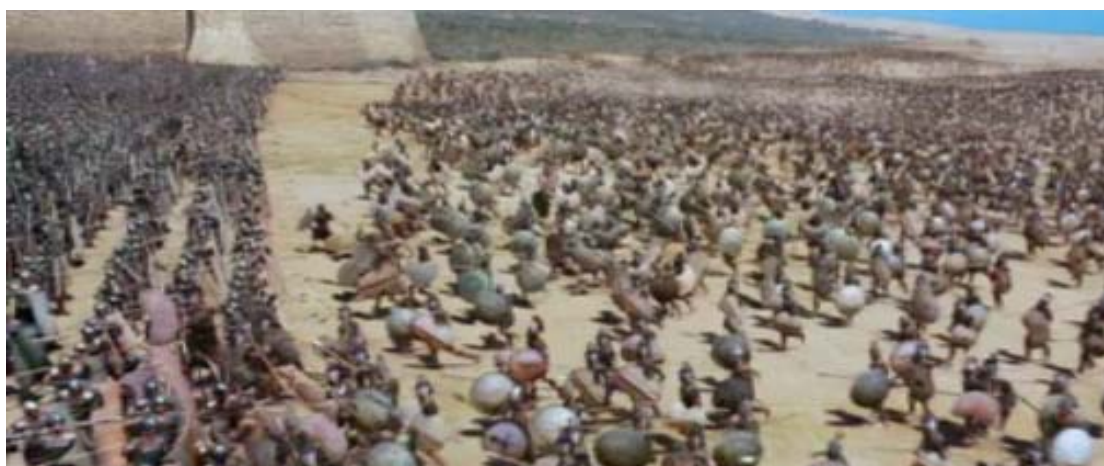
imagen extraída de la película Troya (2004)

Omitimos la condición sistémica de la vida sobre la Tierra cuando invertimos en desarrollo militar y bélico nuestras energías y riquezas. Parece que investigamos cómo romper(NOS) -romper Gaia- desde dentro. El diseño, estudio, investigación, desarrollo de prototipos, pruebas militares, para la creación de armas cada vez más mortíferas, - que como sabemos no sólo matan seres humanos, sino cualquier forma de vida- es el motor principal y parte muy importante de la innovación tecnológica que llevamos a cabo; y en las simulaciones Hollywoodienses, las grandes producciones (de costes desorbitados) reflejo de metas y aspiraciones, admiramos cómo estas nuevas armas provocan genocidios (digitales) sólo comparables a las grandes catástrofes de la humanidad. Los errores humanos se trasvasan, del mundo real al ficticio y del ficticio al virtual, son reintegrados y naturalizados, eliminando la posibilidad de reflexión crítica por parte del espectador. De películas como El señor de los anillos , La Guerra de las Galaxias , Troya , emergerán las bases de videojuegos, en los que la destrucción aporta beneficios al jugador, juegos de muertes digitales masivas que banalizan la guerra y naturalizan el imperialismo y la destrucción. Labran el camino hacia la militarización del mundo y generan el terror suficiente para esa militarización parezca una situación natural.