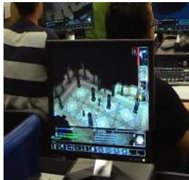
Gráfico n° 2. Escenarios colaborativos del prototipo de videojuego en Neverwinter