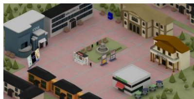
Imagen n° 2: Escenario del Mundo Virtual