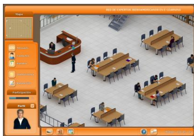
Gráfico n° 3: Interfaz y Biblioteca del Mundo Virtual