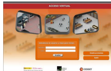
Imagen n° 1: Acceso al Mundo Virtual