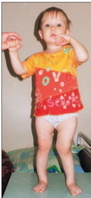
Рис. 3. Девочка с цистинозом