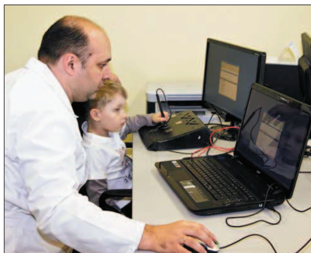
Рис. 5. Оценка когнитивных функций ребенка