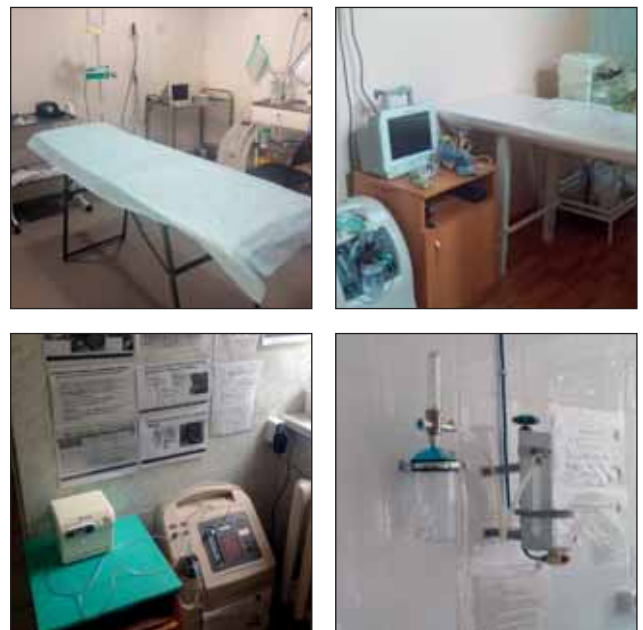
Fig. 4. Equipment in the emergency rooms at the admissions offices of four pilot hospitals in the second audit

Рис. 4. Оборудование в кабинетах неотложной помощи приемных отделений в четырех пилотных стационарах при втором аудите