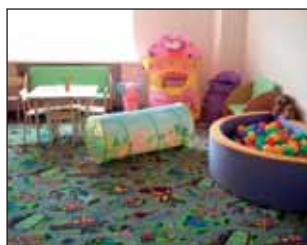
Fig. 6. Playing room, microwave for heating food at pediatric departments

Рис. 6. Игровая комната, микроволновая печь для разогревания пищи в детских отделениях