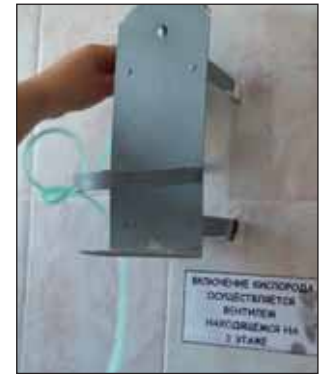
Рис. 4. Оборудование в кабинетах неотложной помощи приемных отделений в четырех пилотных стационарах при втором аудите

Fig. 3. Oxygen equipment in one of the hospitals revised during the first audit