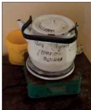
Fig. 5. A hotplate with kettle in the public hall of the pediatric infectious disease department in one of the pilot hospitals

в одной больнице для проведения лабораторной диагностики в ночное время пациентов транспортировали в другое лечебное учреждение (!). Вместе с тем в большинстве больниц не было доступно или было в наличии, но не функционировало оборудование для исследования кислотно-основного состояния крови, в том числе в реанимационных отделениях и палатах интенсивной терапии. Контроль качества работы лабораторной службы осуществлялся в 7 из 10 больниц. Самой большой проблемой было использование лабораторных анализов в реальной клинической практике. Несмотря на круглосуточный режим работы лабораторий в больницах, этой возможностью врачи практически ни в одном стационаре не пользовались. Обычная схема действий педиатров в любое время суток: осмотр — назначение терапии с обязательным в 95% случаев госпитализации антибиотиком — анализы крови и мочи на второй день пребывания в стационаре. Целесообразность и значимость таких анализов вызывает большие сомнения, так как их влияние на принятие решения о терапевтической тактике при таком подходе сводится к минимуму.