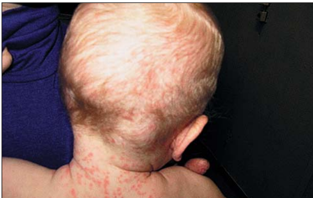
Рис. 3. Пятнисто-папулезная сыпь (1-е сут периода высыпания)