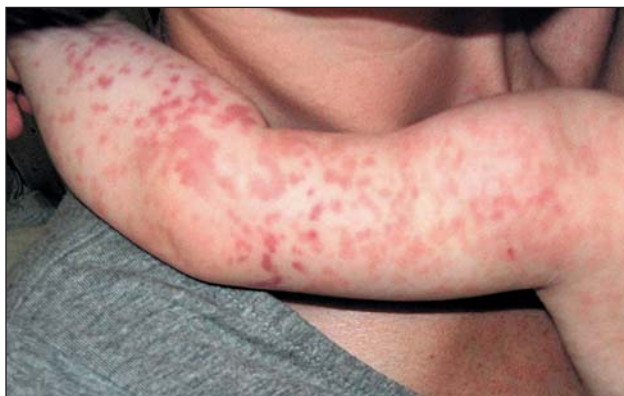
Рис. 6. Элементы пигментации

Симптоматическая терапия включала жаропонижающие, отхаркивающие и противокашлевые средства. Для снижения температуры тела в большинстве случаев (81,8%) назначали ибупрофен (Нурофен для детей в суппозиториях — детям от 3 мес до 2 лет, в суспензии — от 3 мес до 12 лет, в таблетках — от 6 лет и старше) в разовой дозе 5–10 мг/кг до 3–4 раз в сут. В остальных случаях при повышении температуры тела использовали препараты парацетамола.