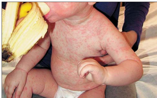
Рис. 5. Сыпь на всей поверхности туловища, конечностей (3-и сут периода высыпания)

тяжелой форме, у 1 ребенка имела место легкая (митигированная) корь. Специфические осложнения кори зарегистрированы у 4 человек (36,4%).