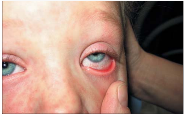
Рис. 2. Сыпь на лице, конъюнктивит (1-е сут периода высыпания)