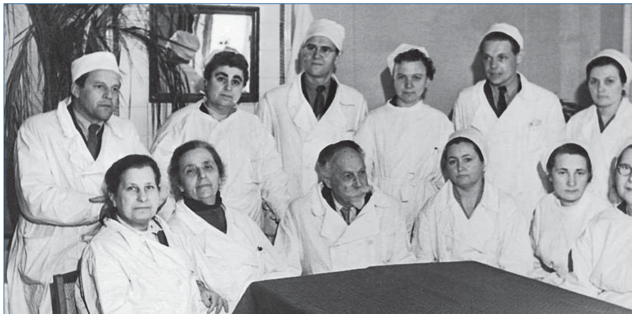
Fig. 1. Georgy Nestorovich Speransky with the staff of the Department of Pediatrics of the CIATD