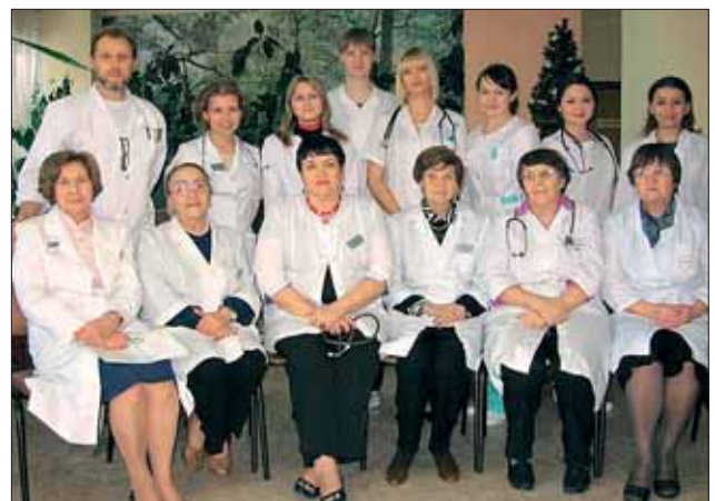
Fig. 4. Staff and residents of the Department of Pediatrics, 2013