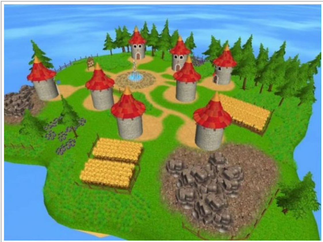
Abb. 2: Screen-Shot aus Village Voices

innerhalb des Dorfes zu setzen. Weil alle Charaktere voneinander abhängig sind, tauchen oft Situationen auf, die zu Konflikten führen und die SpielerInnen sind dafür verantwortlich, diese zu bewältigen. Zum Beispiel könnte die/der HeilerIn eine Pflanze von der/dem WirtIn bekommen wollen, um eine Aufgabe erfüllen zu können, die mit einem Heiltrank zusammenhängt, aber eine lange zurückreichende Geschichte von Konflikten zwischen den beiden könnte dazu führen, dass die/der WirtIn abgeneigt ist, in Handelsbeziehungen mit der/dem AlchemistIn zu treten. Es ist wichtig, dass die Charaktere kontinuierliche Beziehungen sowohl mit anderen Charakteren als auch mit sogenannten non-player-Characters (NPCs) haben, denn das Spiel dreht sich um die Handhabung dieser Beziehungen.