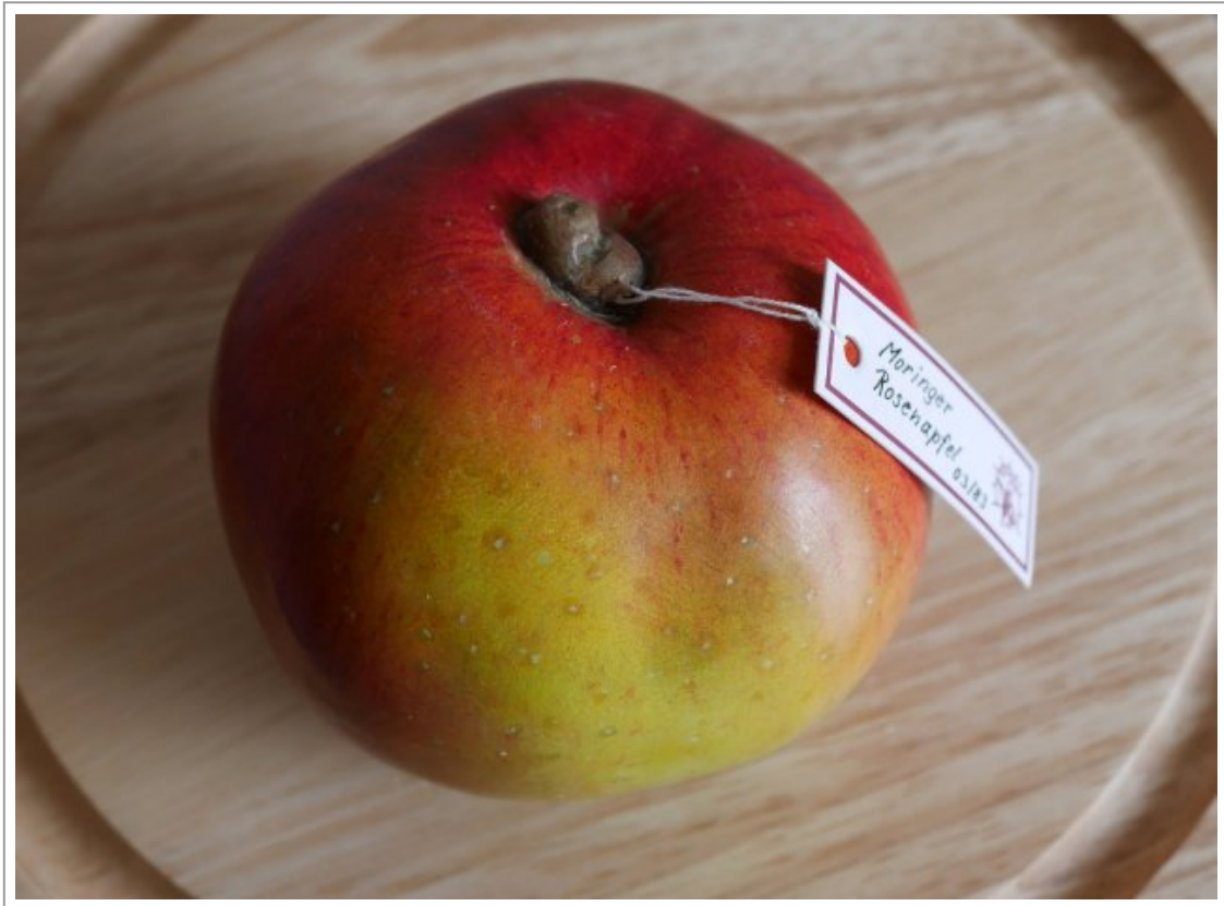
Abb. 5: Moringer Rosenapfel von SOMSO, um 2010

und Pflaume, aber auch für Speise- und Giftpilze. Ihr Ziel war eine perfekte äußerliche Nachahmung der Früchte nicht nur in Größe und Form, sondern auch Farbgebung, Oberflächenbeschaffenheit sowie typischen Schadbildern wie Druckstellen oder Pilzbefall.