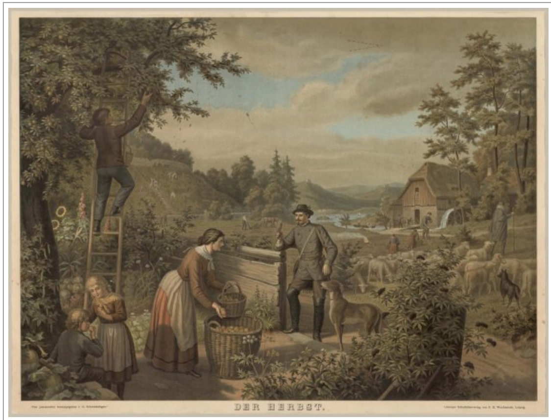
Abb. 7: Der Herbst, Vier Jahreszeiten herausgegeben von G. Schweissinger, Leipzig: F. E. Wachsmuth, um 1911 (Abb. AU Library, Campus Emdrup – University of Aarhus).

blühende Baum ein Anzeiger für den Frühling, der fruchttragende Baum in Ernteszenen für den Herbst.