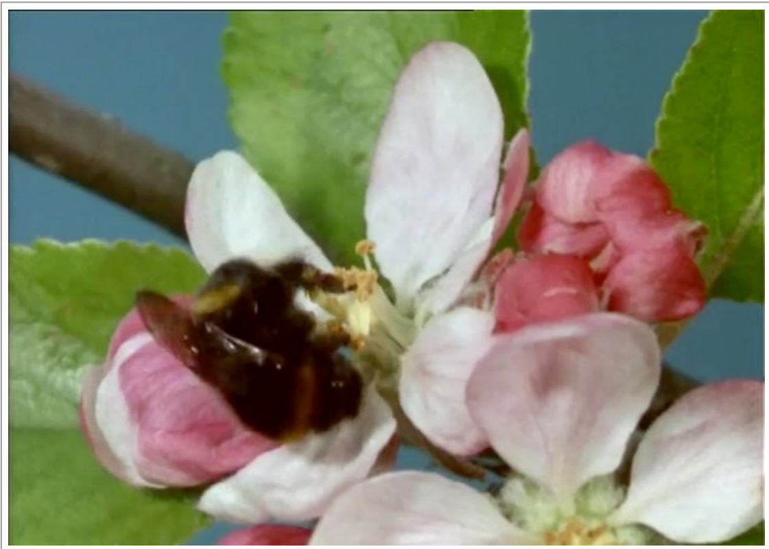
Abb. 10: (BRD-Lf. 26:07, IWF Göttingen 1994, online unter: http://dx.doi.org/10.3203/IWF/C-1859#t=22:11,26:07 ).

Strukturzusammenhang, der eine besondere Überzeugungskraft hat. In den Lehrfilmen "Bestäubung und Befruchtung" (DDR-Lf. F 1042, Defa 1980, 16mm) und "Blütenökologische Beziehungen zwischen Hummeln und ihren Trachtpflanzen" (BRD-Lf. 26:07, IWF Göttingen 1994) wird beispielsweise die Bestäubung von Apfelblüten in Bildraum füllenden Nahaufnahmen gezeigt. Zoom und Slow Motion dienen dazu, die Bewegungen der Insekten nachvollziehbar zu zeigen.