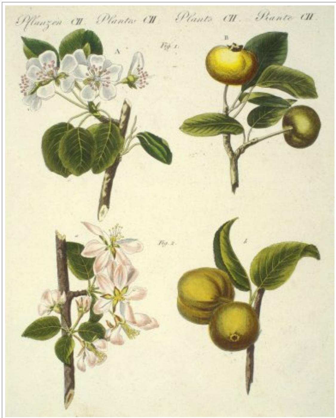
Abb. 4: Handkolorierte Bildtafel; Blüten- und Fruchtstand der wild vorkommenden Varianten von Apfel- und Birnenbaum (Bertuch 1805, Bd. 5, Tafel 82, Abb. Pictura Paedagogica Online).