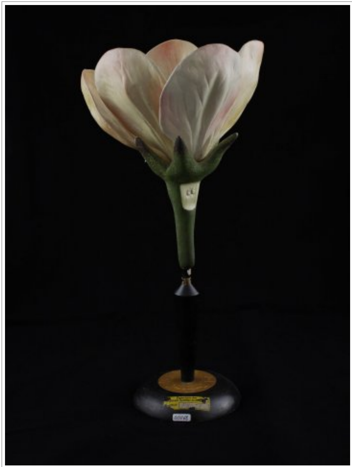
Abb. 6: Modell der Apfelblüte von Osterloh-Modelle (Leipzig) im Maßstab