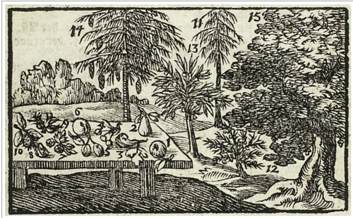
Abb. 1: Holzschnitt zum Gegenstandsbereich der Bäume (Comenius 1745–1746, Bd.1, 30, Abb. Pictura Paedagogica Online); der Apfel ist mit der Ziffer 1 indexikalisch ausgewiesen und mit "Der Apfel 1 ist rund" im Text beschrieben.

Die Abbildungen sind stark vereinfachte Icons zur Verknüpfung von Sach- und Sprachwissen – eine Dynamik, die die Basis des Anschauungsunterrichts bildete und sich bis in dessen modernste Ausprägungen hineinzieht. Überdies ist der Apfel aufgrund seiner Gewöhnlichkeit ein gutes Exempel, um als Lebensmittel etwa den Geschmackssinn zu repräsentieren, so in Johann Heinrich Campes "Kleiner Seelenlehre für Kinder" (Hamburg 1780).