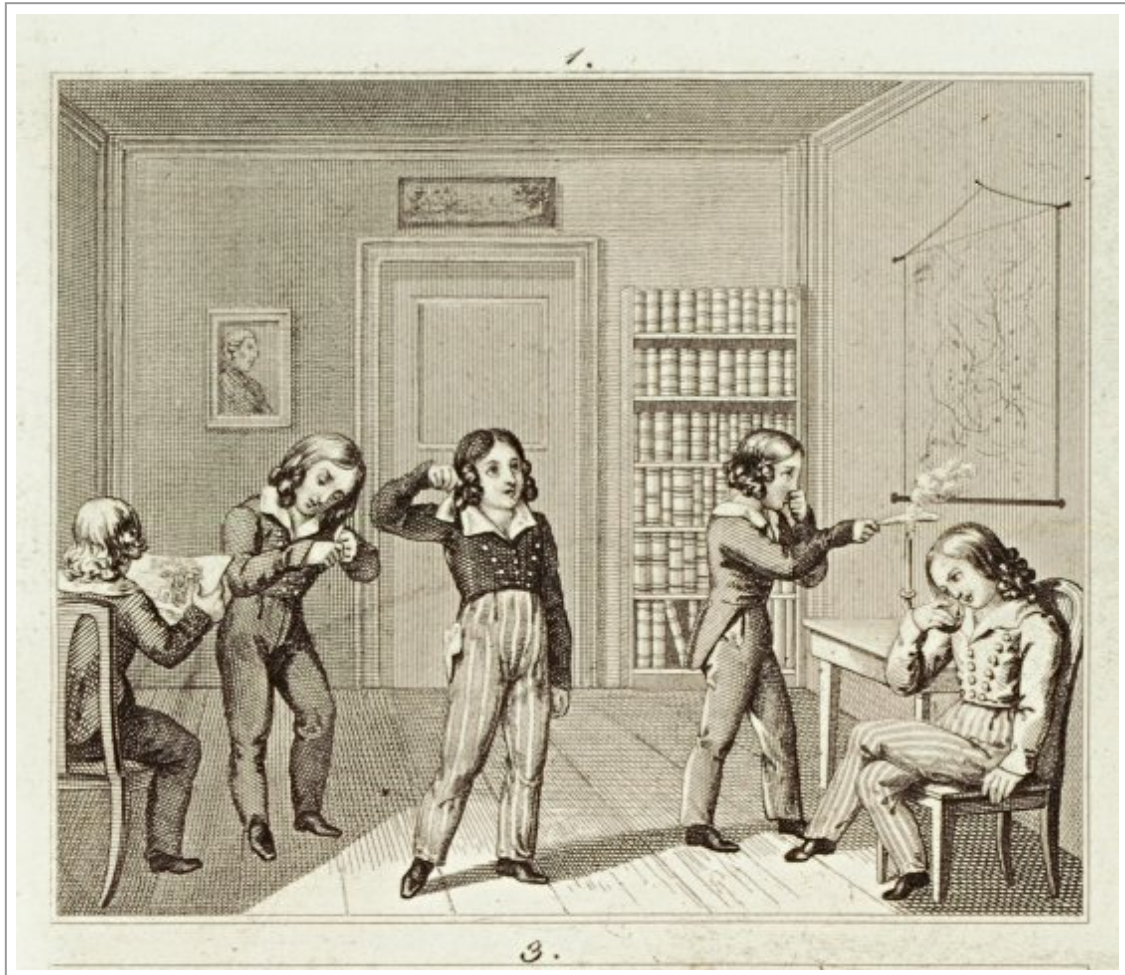
Abb. 2: Der am rechten Bildrand sitzende Knabe ist ganz in den Genuss eines Apfels versunken (Campe 1828, Tafel 1, Abb. Pictura Paedagogica Online).

In Zeichenanleitungen dient der Apfel als leicht vorstell- und beschaffbare Vorlage, an der sich die Entwicklung von Schraffuren und Schattenwürfen für die Oberflächenstrukturierung einfacher Objekte nachvollziehen lässt. Als Zeichen im Sinne von Anzeichen taucht deshalb der Apfel immer wieder in Darstellungen zu den vier Jahreszeiten auf. Das Erntesujet mit Körben voller Äpfel findet sich von der frühen Neuzeit bis in das 20. Jh. (Stach/Koch 1988).