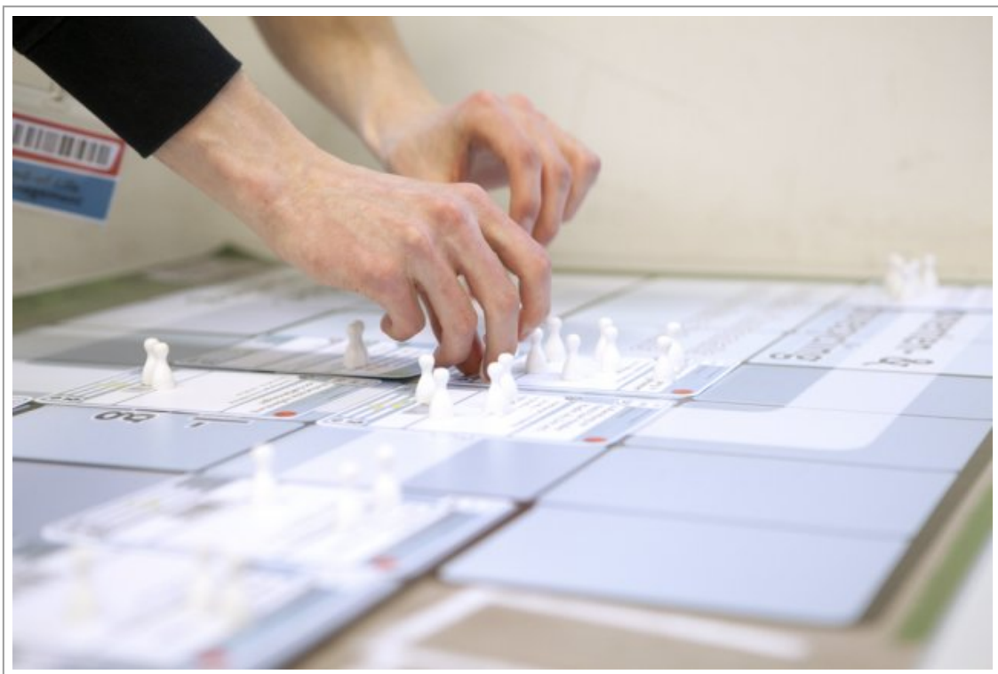
Abb. 5: Spielhandlungen innerhalb einer Unterabteilung[6]

Szenario gibt vor, dass voraussichtlich nur jene Marken weitergeführt werden, die bei der Umstrukturierung besonders erfolgreich sind – es entsteht also ein Konkurrenzverhältnis. Innerhalb der Marken teilen sich die Studierenden nochmals in Unterabteilungen für die Bereiche Produktmanagement, Produktionsmanagement, Sales- und Aftersales-Management und das End-of-Life-Management auf. Eine erfolgreiche Umstrukturierung ist nur durch eine gute Koordination zwischen den Abteilungen, die ihrerseits um knappe finanzielle und personelle Ressourcen konkurrieren, möglich.