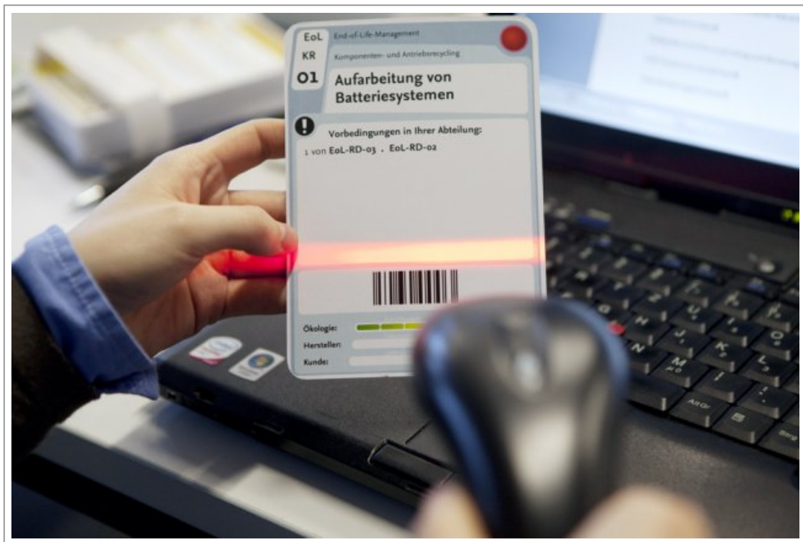
Abb. 6: Scannen einer Strategiekarte zur 'Übersetzung' in die symbolische Prozessierung im Computer[7]

einer konstruktivistisch begründeten Didaktik, konstruieren sie ihre Inhalte also bis zu einem gewissen Grad selbst und bekommen durch die Lehrenden lediglich den Möglichkeitsraum dafür bereit gestellt. Aus medientheoretischer Perspektive stellen die Spielmaterialien materielle Artefakte dar, die für die symbolische Verwendung freigestellt sind. Das Handeln mit dem Material wird so zum Handeln mit Signifikanten, kurz: zum Probehandeln.