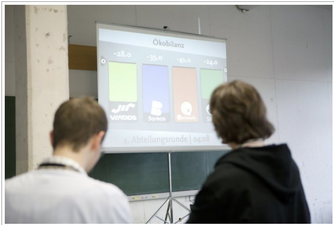
Abb. 7: Feedback aus der Simulation in Form von Kennzahlen[8]

behavioristischer Sicht sind die Rückmeldungen als Reize (medientheoretisch: Symbole) zu veranschlagen, die auf bestimmte symbolische Handlungen folgen und als Belohnung oder Bestrafung interpretiert werden können. Aus kognitiver Perspektive ist das Feedback ein Indiz dafür, ob die Studierenden das vermittelte Wissen adäquat verinnerlicht haben und in Handlungen umsetzen können. Vom konstruktivistischen Paradigma aus betrachtet, ist es eine Rückmeldung über die Viabilität der eigenen Konstrukte und darauf begründeten Handlungen. Ggf. werden die Konstrukte bestätigt, erweitert oder aber dekonstruiert und durch neue Konstruktionen ersetzt, die dann ihrerseits im nächsten Durchlauf geprüft werden usw.