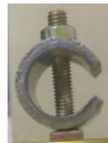
Gambar 2. Spesimen setelah dilakukn pembebanan