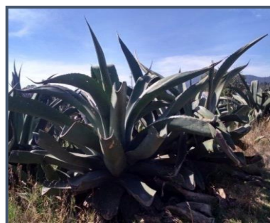
d) maguey manso