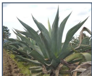
f) maguey púa larga