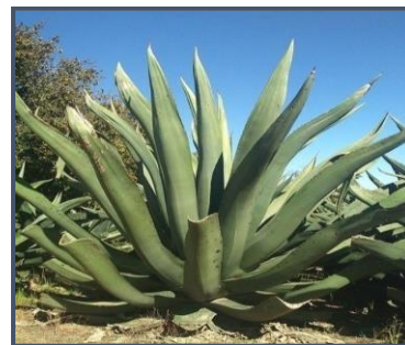
g) maguey ayoteco