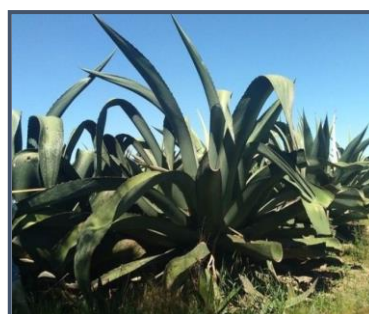
e) maguey chalqueño