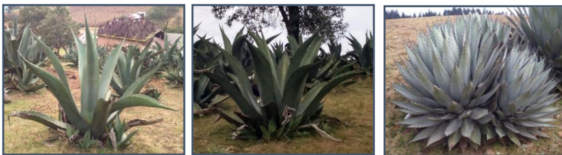
a) maguey blanco