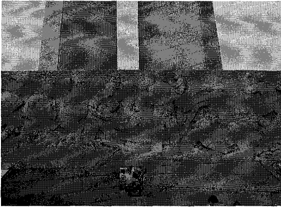
図2 抗震記念碑のレリーフ