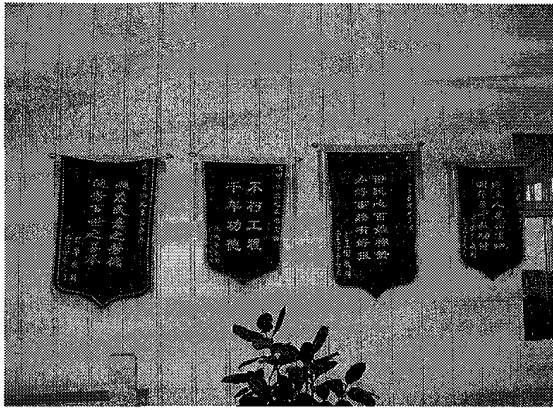
図3 会社の応接室に展示されている 記念壁の建設を讃える錦の旗

の霊を追悼しにきた。例年と違っているのは悲しみ以外に感激や慰められる気持ちがある。」(感謝の手紙)