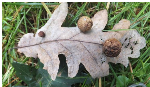
Фото 2. Гали Cynips quercusfolii на листовій пластинці дуба (С. І. Клименко)

Личинки бігамного покоління розвиваються на старих стовбурах, рідше – на гілках, у сплячих бруньках. Вони утворюють яйцеподібні гали довжиною 2,5–3,5 мм, коротко й густо опушені червонуватими чи фіолетовими волосками, часто оточені лусочками бруньок біля основи. Гали зазвичай трапляються по декілька разом. Дозрівають у травні–червні. Личинки агамного покоління розвиваються на жилках із нижнього боку листків. Вони утворюють кулеподібні, до 25 мм у діаметрі м'ясисті, соковиті гали. Зовні вони гладенькі, із невеликими горбиками чи шипиками. У центрі галу розміщена овальна личинкова камера до 4 мм у діаметрі. Забарвлення зелено-жовте із червоними бочками із сонячного боку. На одному листі буває до 16–18 галів. Вони з'являються в червні, дозрівають у вересні–жовтні та опадають на землю з листям. Виліт горіхотворок – у листопаді–грудні.