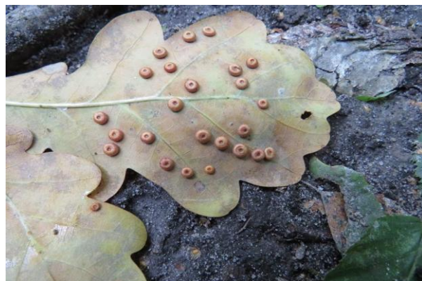
Фото 3. Гали Neuroterus numismalis на листовій пластинці дуба (С. С. Штокало)

Самка агамного покоління – 2,6–3,0 мм. Тіло чорне, за винятком коричневих стегон, гомілок,