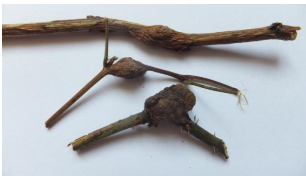
Фото 8. Гали Lasioptera rubi на стеблах Rubus sp. (С. І. Клименко)

Особливості морфології та біології. Самка має довжину 1,6—2,2 мм. Тіло чорне, спинка коричнева, покрита світло-жовтими волосками. Ноги коричнево-жовті, крила прозорі. Під час цвітіння малини самки відкладають 8–15 яєць на молоді пагони малини й ожини ( Rubus idaeus L., R. caesius L.). Через 8–10 днів відроджуються мікроскопічні безногі личинки оранжевого кольору, які заповзають під кору стебла. Вони живляться соком пагона, індукуючи на місці пошкодження утворення нарості (гала), що досягають 3 см у довжину та 2 см у ширину. Личинки зимують у галах. Навесні в кожному галі міститься від 2-х до 11-ти личинок. Досягнувши довжини 3–4 мм, вони заляльковуються навесні всередині галів в окремих камерах. Лялечки зариті в павутинистих несправжніх коконах.