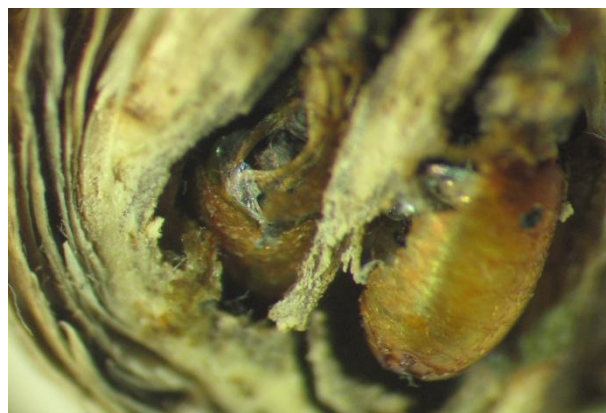
Фото 7. Пупарії Urophora quadrifasciata в суцвітті волошки (С. І. Клименко)

Особливості морфології та біології. Самка довжиною 2–3 мм [5]. Тіло темне; крило із жовтою основою, чотирима перев'язами на крилах, злитими попарно. Яйцеклад висувний. Вид бівольтинний. Личинки розвиваються в насіннєзачатках Centaurea jacea , Centaurea maculosa [4]. Імаго зимуючого покоління виводиться з галів у дозрілих суцвіттях навесні, коли починають формуватися нові квіткові бруньки. Після спарювання самка сідає на квіткові бруньки, щоб відкласти яйця між тичинок. Вона може відкласти більше одного яйця в одне суцвіття. Через 3–4 дні з яєць виходить личинка, котра починає живитися тканинами суцвіття, унаслідок чого рослина стає формувати гал через вісім днів після відкладки. Через 15 днів після вилуплення личинки гал набуває максимальних розмірів. Для появи нового покоління потрібно 8–9 тижнів із моменту вилуплення з яйця. Наступне (літнє) покоління зимуватиме в суцвітті у вигляді зрілих личинок і з'явиться наступною весною вже як імаго.