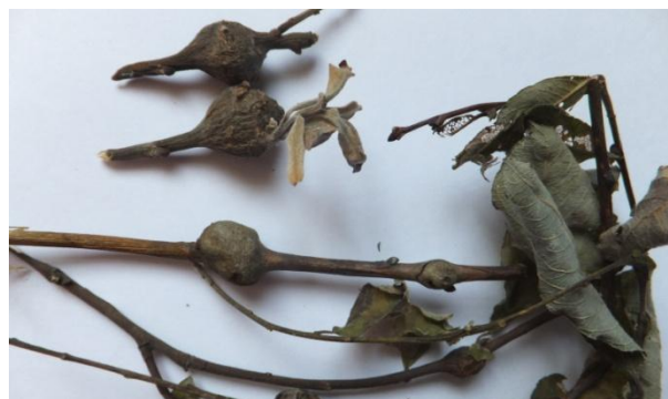
Фото 5. Гали Euura amerinae на гілках Salix pentranda

Особливості морфології та біології. Довжина тіла – 5–6 мм [8]. Тіло струнке. Голова з великим жовтим рисунком. Щелепи дещо асиметричні. Вусики ниткоподібні, короткі. Вусики самки за довжиною дорівнюють голові й грудям, разом узятим, у самця – довші. Ноги жовті, лише в основі та вершині буруваті. Зазвичай індукує гали на Salix pentranda L. (Liston, 1982). Уражує також і види тополь ( Populus nigra L., P. tremula L.). Личинки розвиваються у великих дерев'янистих багатокамерних галах на тонких гілках. Гали довжиною 2–3 мм. У міру росту личинок гал виростає на 30 %. Із кінця червня гали стають важчі за гілки. Кількість личинок на один гал варіює від 2 до 6. Протягом перших двох стадій розвитку личинки харчуються окремо у своїх комірках, не з'єднані між собою. Зимують у галах дорослі личинки – еонімфи. Імаго з'являються в травні. Протягом року розвивається одне покоління.