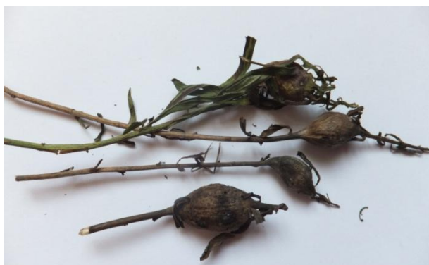
Фото 4. Гали Aulacidea hieracii на стеблі Hieracium umbellatum (С. І. Клименко)

Особливості морфології та біології. Самка – 2,3–3,1 мм [9]. Голова й черевце чорні; вусики темно-коричневі. Жилки крила помітні, темно-коричневі. Вусики 13-членикові. Черевце приблизно такої довжини, як голова та груди, разом узяті. Самець – 1,6–2,3 мм. Схожий на самку, але вусики 14-членикові. Вид моновольтинний. Личинки розвиваються на стеблах нечуйвітру ( Hieracium vulgatum , H. pilosella , H. umbellatum , H. virosum ). Зовні стебла дуже деформовані, на них формуються