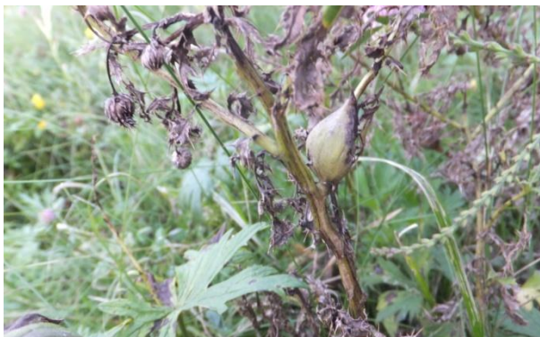
Фото 6. Гал Urophora cardui на стеблі Cirsium arvense (С. І. Клименко)

Яйця відкладають у суцвіття чи в стебла осоту польового ( Cirsium arvense (L.)) раннім літом. U. cardui зазвичай формує веретеноподібні гали на стеблі Cirsium arvense . Гал містить серію вертикальних личинкових камер, що оточують стеблову вісь. Личинки розвиваються до наступної весни. Виліт відбувається в травні–червні.