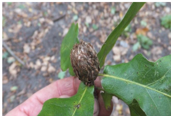
Фото 1. Гал Andricus foecundatrix на верхівковій бруньці дуба (С. І. Клименко)

Агамне покоління. Самка – 4,5–4,9 мм. Голова, вусики й груди чорні; тазики, стегна в базальній частині чорні, гомілки та лапки ніг темно-коричневі. Жилки крила темно-коричневі. Вусики 14-членикові, трохи довші ніж голова й груди, разом узяті. Личинки агамного покоління розвиваються в бруньках. Вони утворюють великі гали довжиною до 25 мм, за формою нагадують шишку хмелю. Зовнішні лусочки широкі, внутрішні вузькі. Основа гала щільна. Усередині розміщений внутрішній гал довжиною до 7 мм. За формою він довгастий, зрідка кулеподібний, близько 5 мм у діаметрі. Спочатку однокамерний внутрішній гал світло-зелений, потім – бурий. Гали починають з'являтися в травні. До кінця липня більшість галів дозрівають й опадають на землю. Розвиток личинки горіхотворки часто продовжується до квітня третього року, дорослі самки народжуються на третю весну.